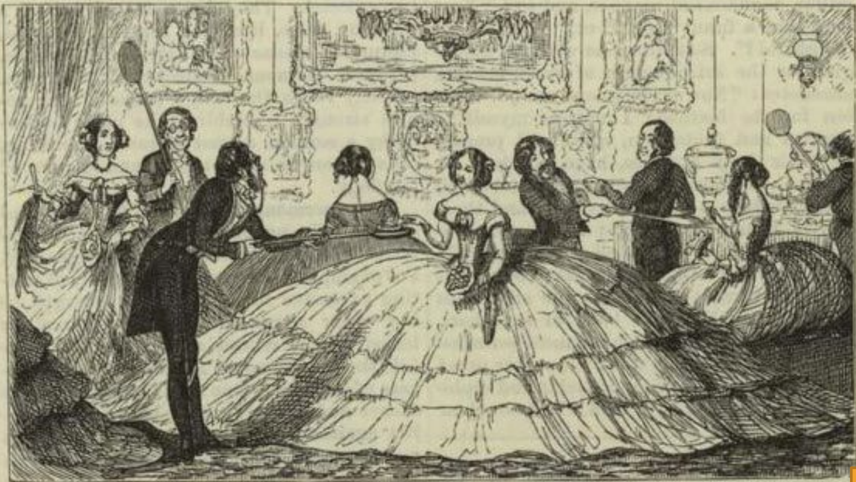
A SPLENDID SPREAD, — CRUIKSHANK, 1800.