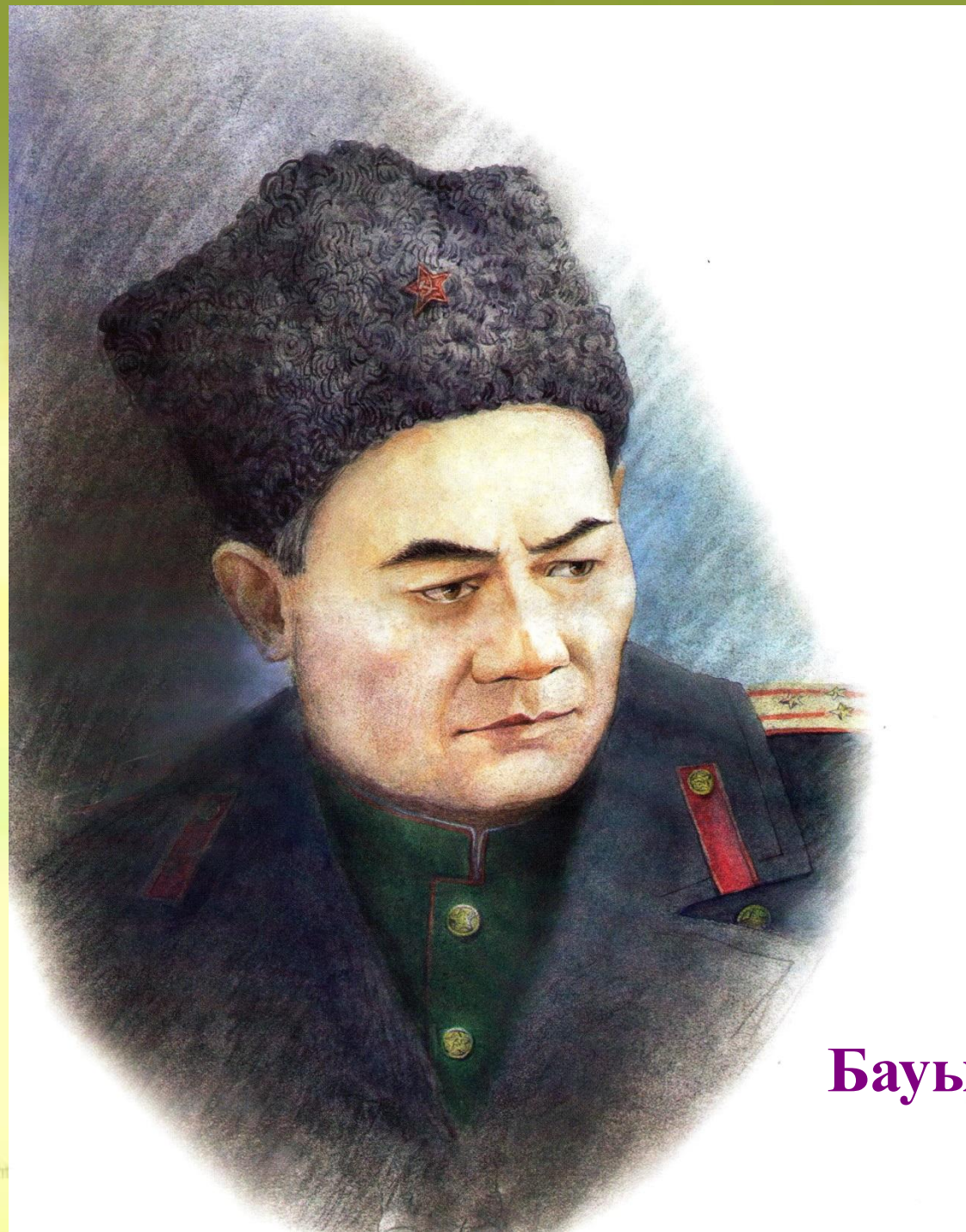
Бауыржан Момышұлы (1910-1983)