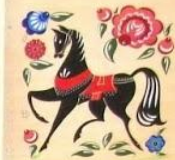
Декоративная тарелка «Конь»