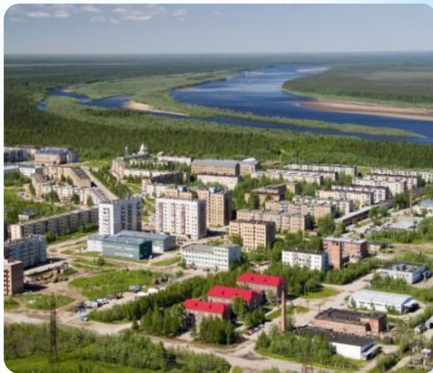
Город Вуктыл вид с высоты птичьего полета

Наш город расположен на правом берегу реки Печора.