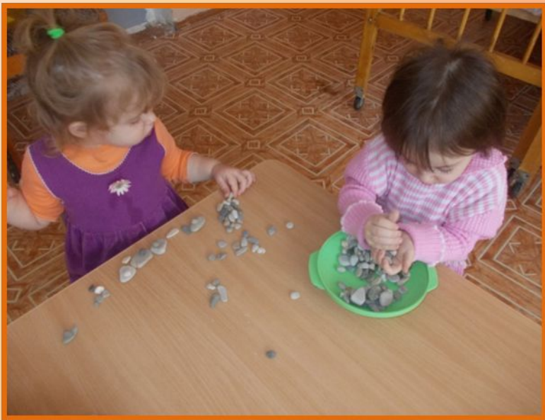
Игры с конструктором