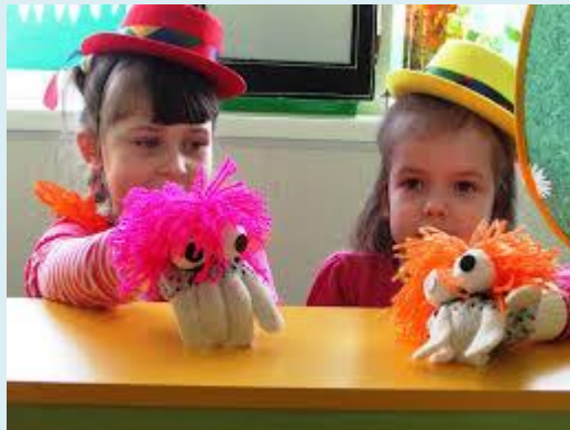
Театр перчаток и шляп