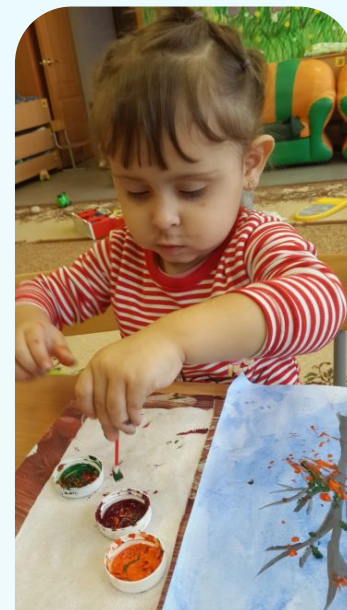
Рисование ватными палочками