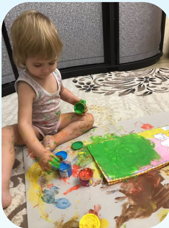
Катюшина «зелёная поляна»