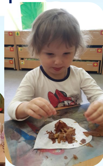
Разукрашивание природного материала