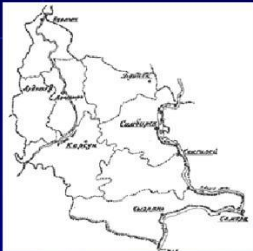
Территория губернии в 1851-1920 гг.

С 1851 г. до 1920 г. Симбирская губерния существовала в составе 8 уездов: