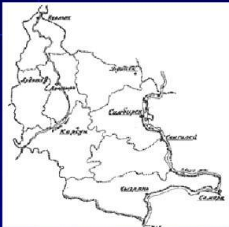
Территория губернии в 1851-1920 гг.

С 1851 г. до 1920 г. Симбирская губерния существовала в составе 8 уездов: