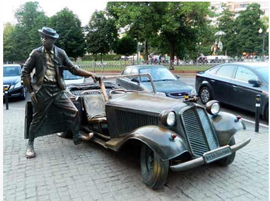
Памятник Никулину возле цирка на Цветном бульваре

В память о великом артисте в разных городах России установлены мемориальные доски в его честь, а также многочисленные памятники. В частности таковые можно встретить в Хабаровске, Курске, Иркутске, Сочи и в родном для актера городе Демидове. Кроме того, в его честь назван цирк на Цветном бульваре, с которым долгое время была связана жизнь и судьба актера. Имя Юрия Никулина носит также крупный теплоход, приписанный к порту Ростова-на-Дону.