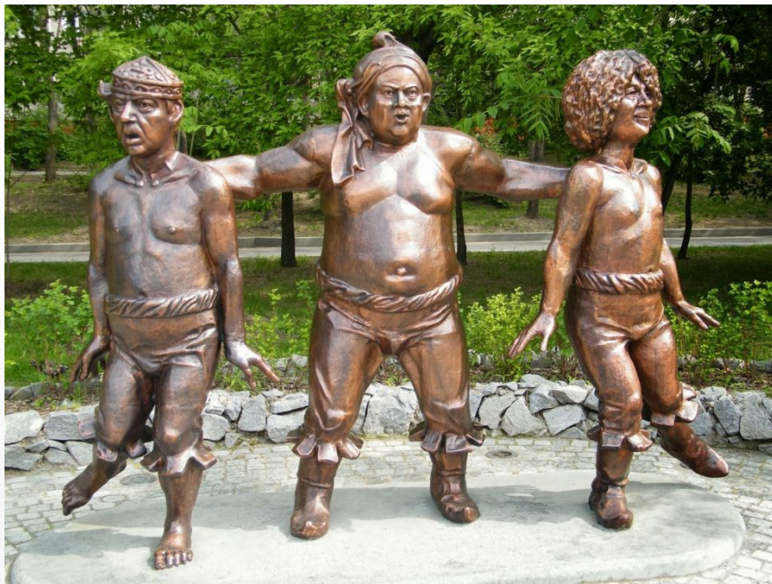
Памятник Бывалому, Трусу и Балбесу в Хабаровске