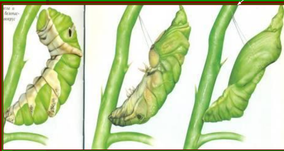
Превращение гусеницы в куколку