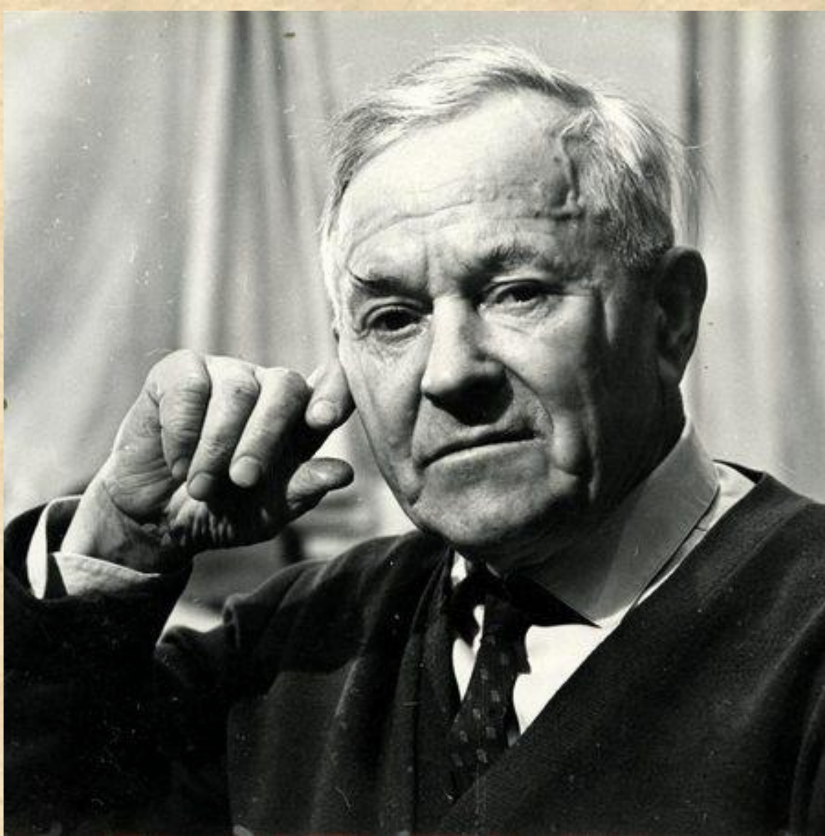
Аркадий Алексеевич Пластов