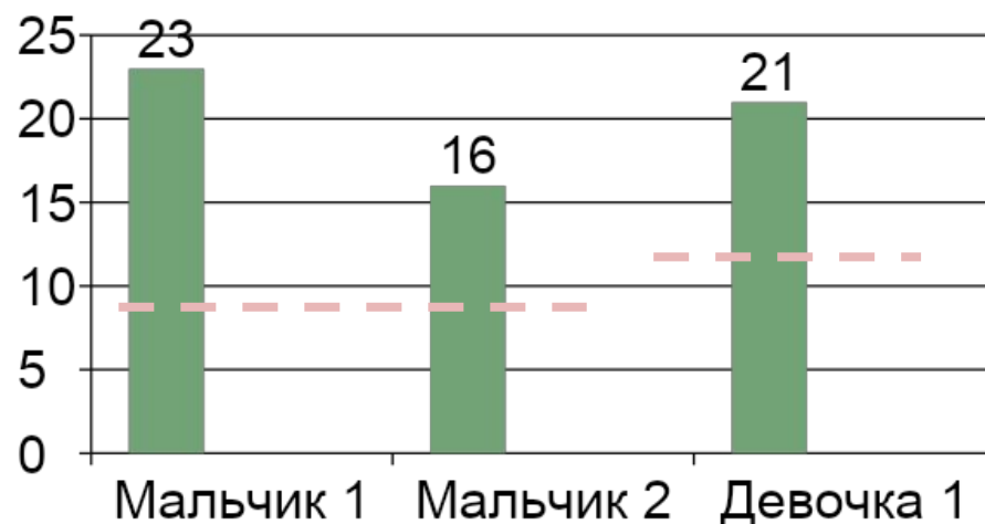
Рисунок 1 - Число страхов у слабовидящих детей одиннадцати лет 4 «В» класса, имеющих умеренную умственную отсталость, на начало 2016-2017 учебного года

* норма для слепых и слабовидящих младших школьников с умеренной умственной отсталостью