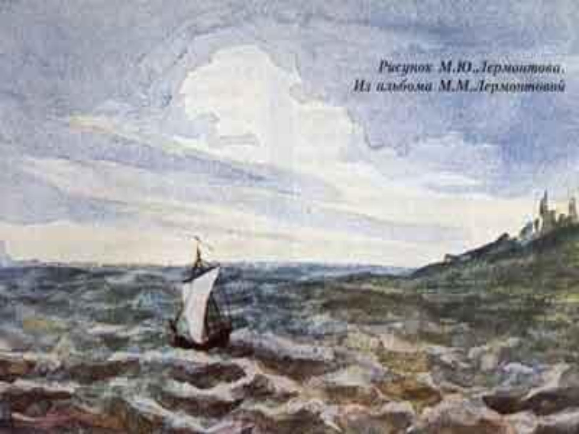
Рисунок М.Ю. Лермонтова. Из альбома М.М. Лермонтовский