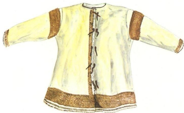
ДЬАХТАР ИСТЭЭХ СОНО. 18 үйө ЖЕНСКАЯ ВЕРХНЯЯ ОДЕЖДА. 18 век