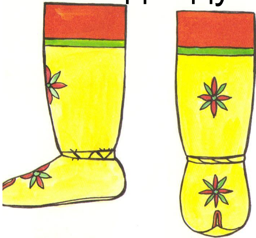
Торбаса из ровдуги

1. В какое время года могли носить эту одежду? 2. Из какого материала раньше шили одежду жители Якутии?