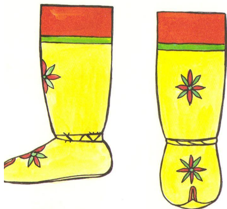
САРЫЫ ЭТЭРБЭС ТОРБАСА "САРЫЫ" ИЗ РОВДУГИ

Рассмотрите иллюстрации и Тема урока. определите тему урока. Одежда народа саха