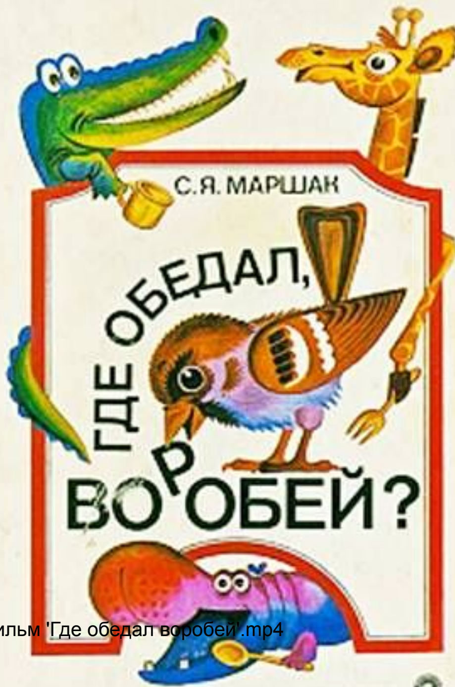
Мультфильм 'Где обедал воробей'.mp4