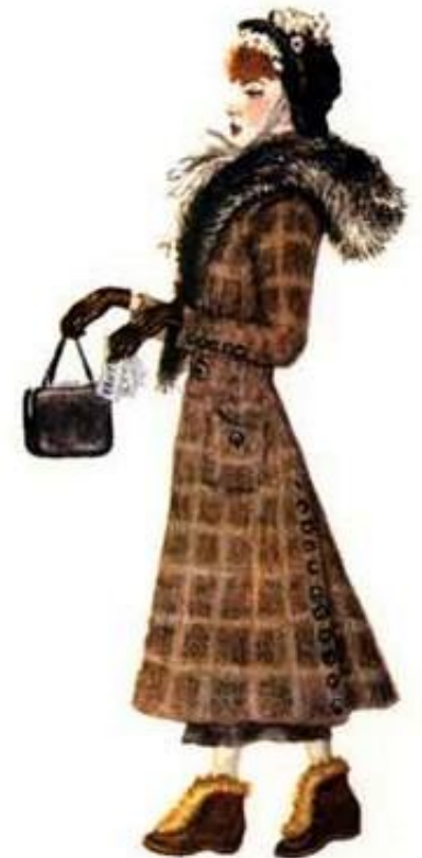
Читаем детские книжки. Самуил Маршак. Загадки для маленьких..mp4