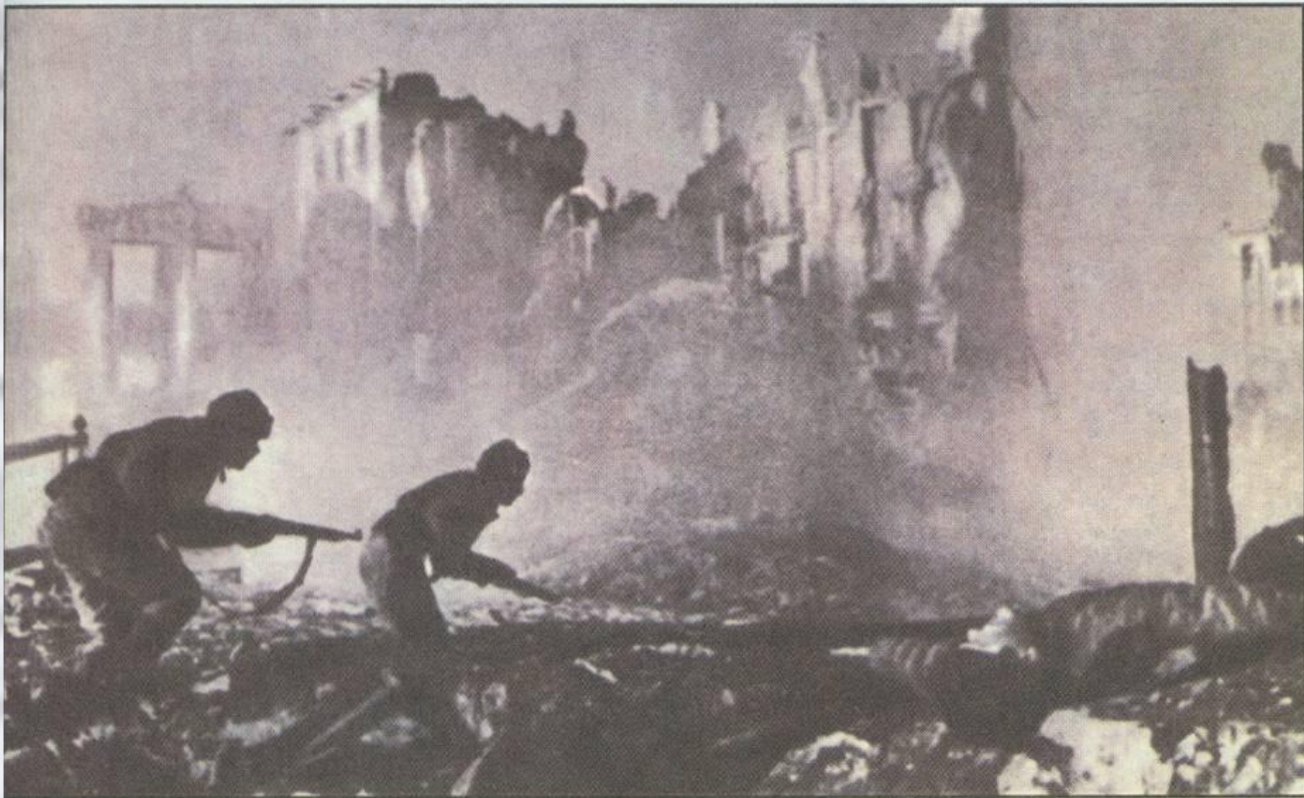
Уличные бои в Сталинграде