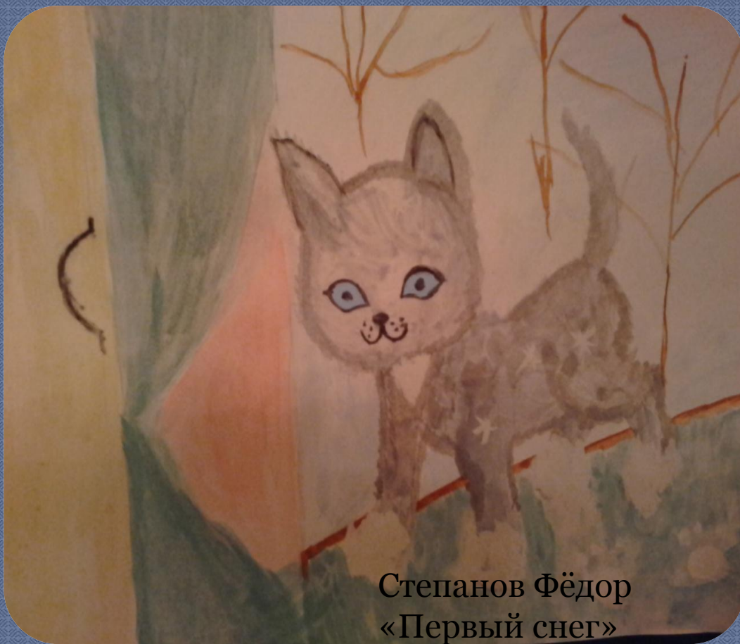
Степанов Фёдор «Первый снег»

Он кружится, Легкий, Новый, У ребят над головой,