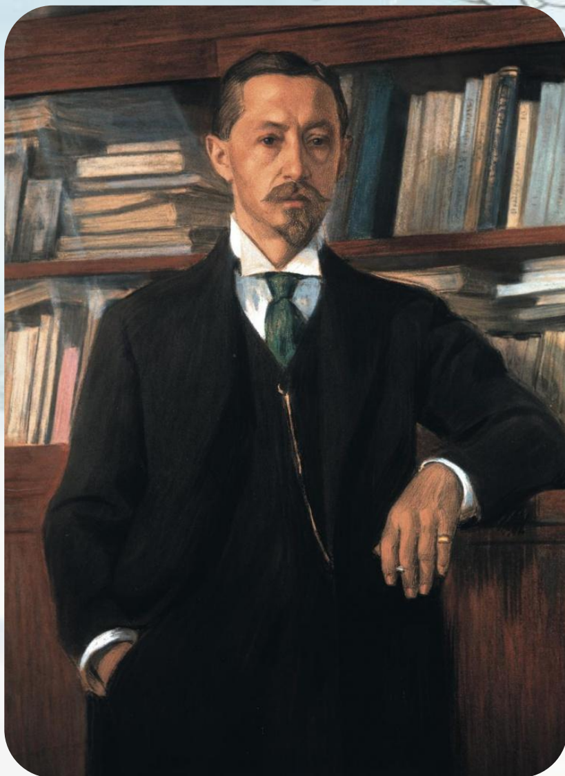
Бунин Иван Алексеевич (1870—1953), прозаик, поэт, переводчик.