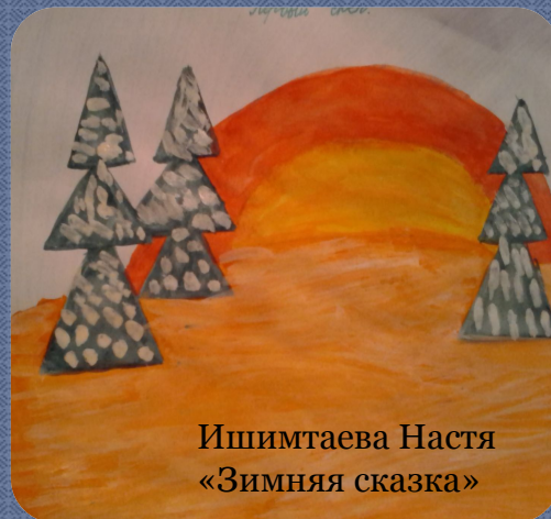
Ишимтаева Настя «Зимняя сказка»