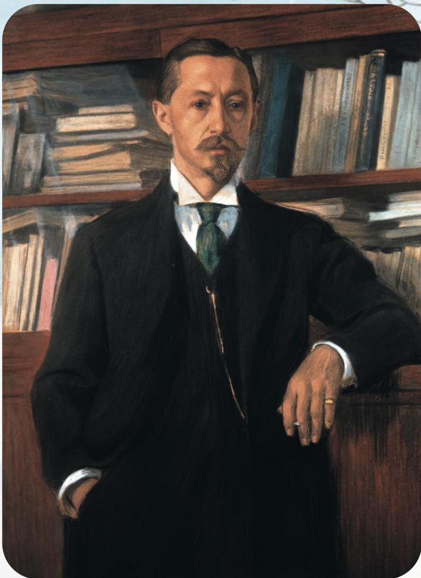
Бунин Иван Алексеевич (1870—1953), прозаик, поэт, переводчик.