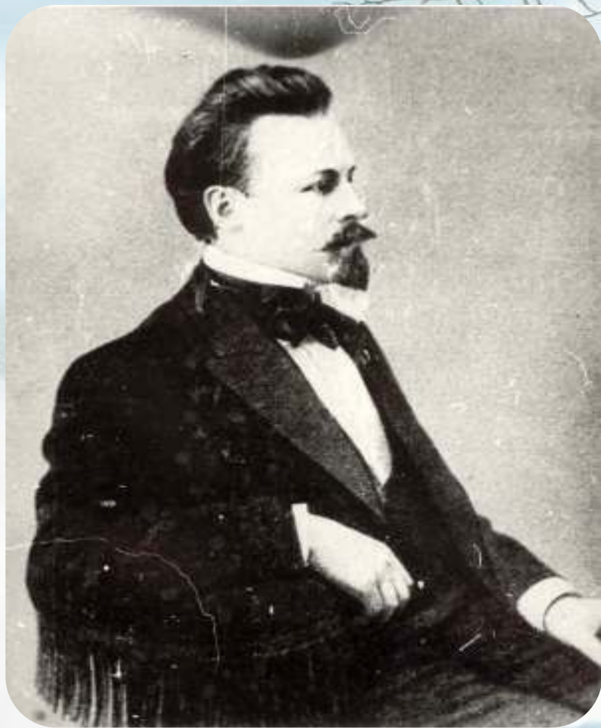
Бальмонт Константин Дмитриевич (1867-1942 гг.)