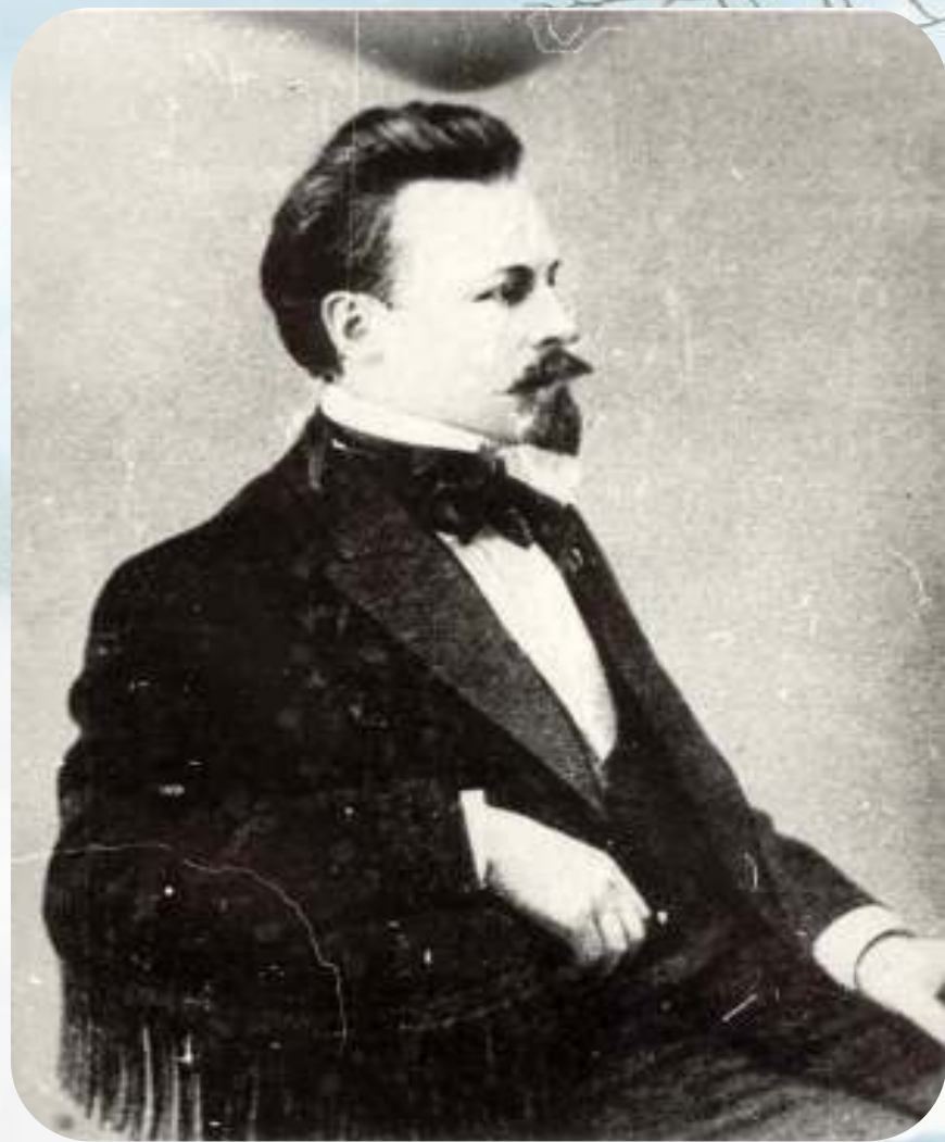
Бальмонт Константин Дмитриевич (1867-1942 гг.)