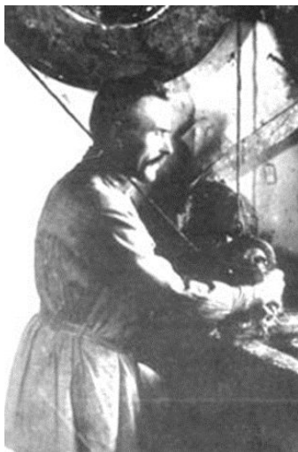
Василий Звездочкин за работой

Первую русскую матрёшку изобрел токарь В. П. Звёздочкин в 1890-х годах. Автор первой росписи -художник С. В. Малютин.