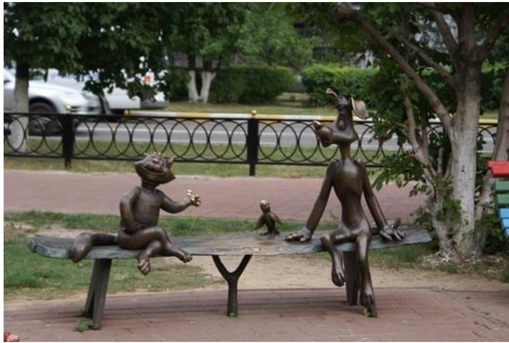
Кот Матроскин и Шарик