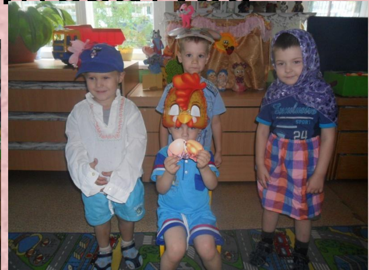
Инсценировка «РЕПКА» И «КУРОЧКА РЯБА»