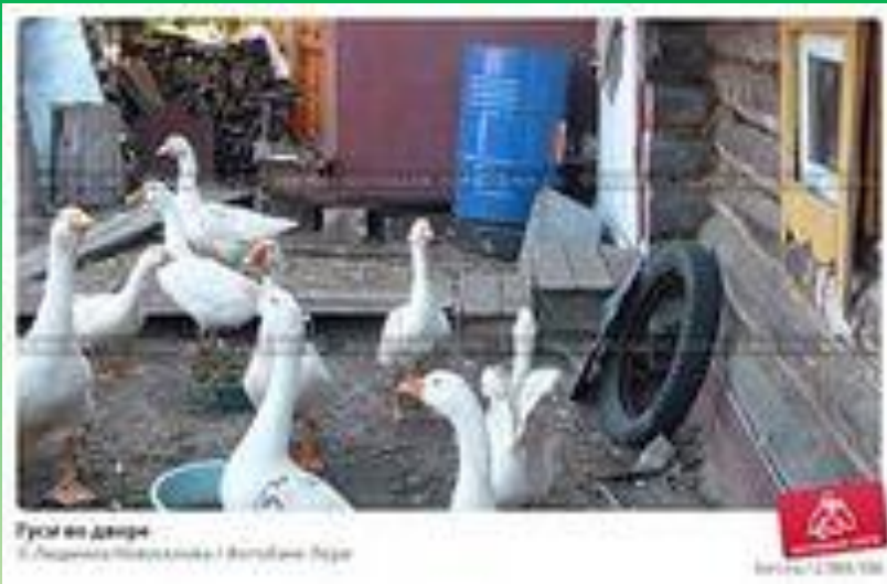
Гуси во дворе