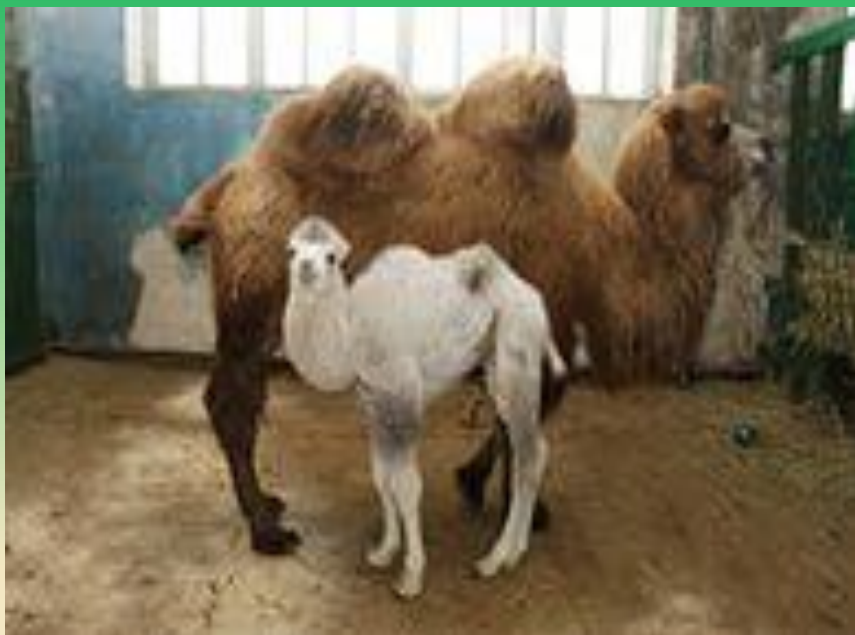
Теміні кичг- ботхн.

Хойр бгкті, Хатханчик идні. Туула урлта, Туурсн нерті.