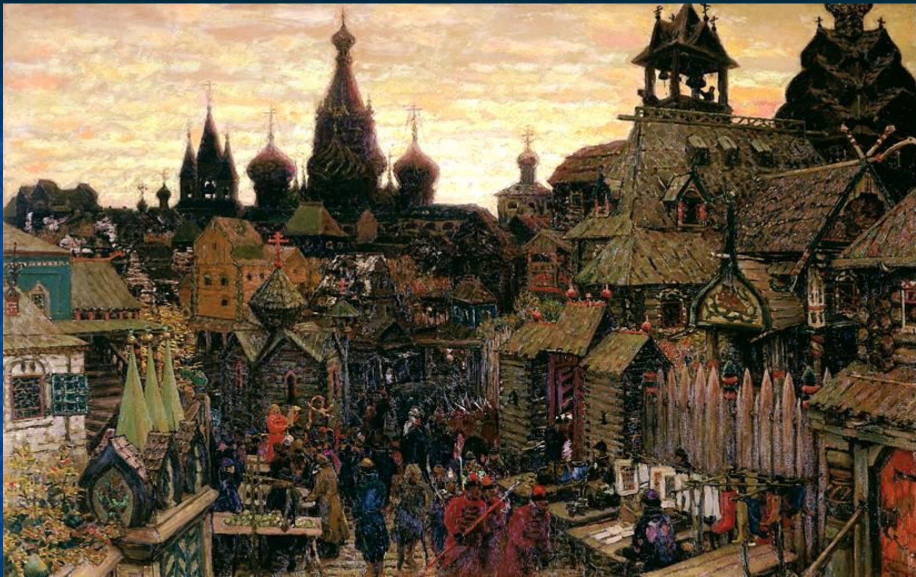
А. Васнецов «Старая Москва»