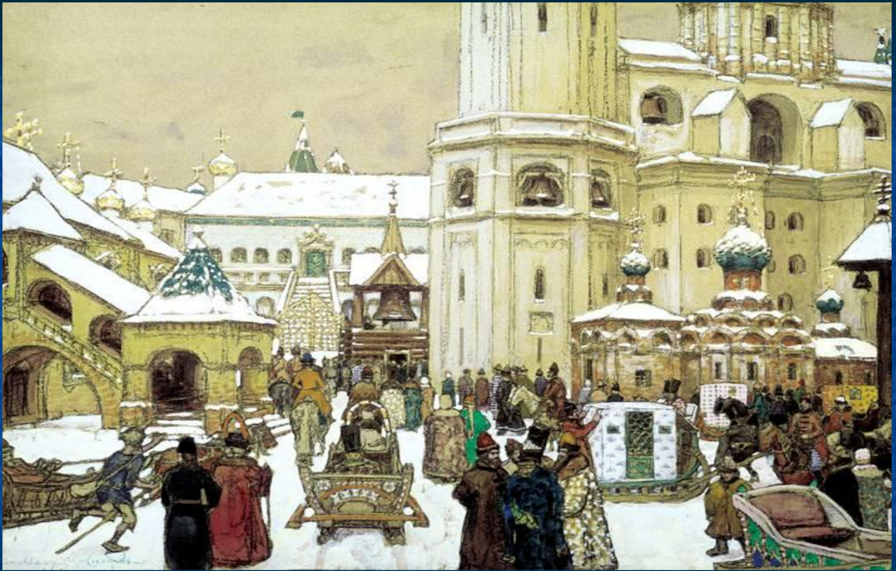
Площадь Ивана Великого в Кремле