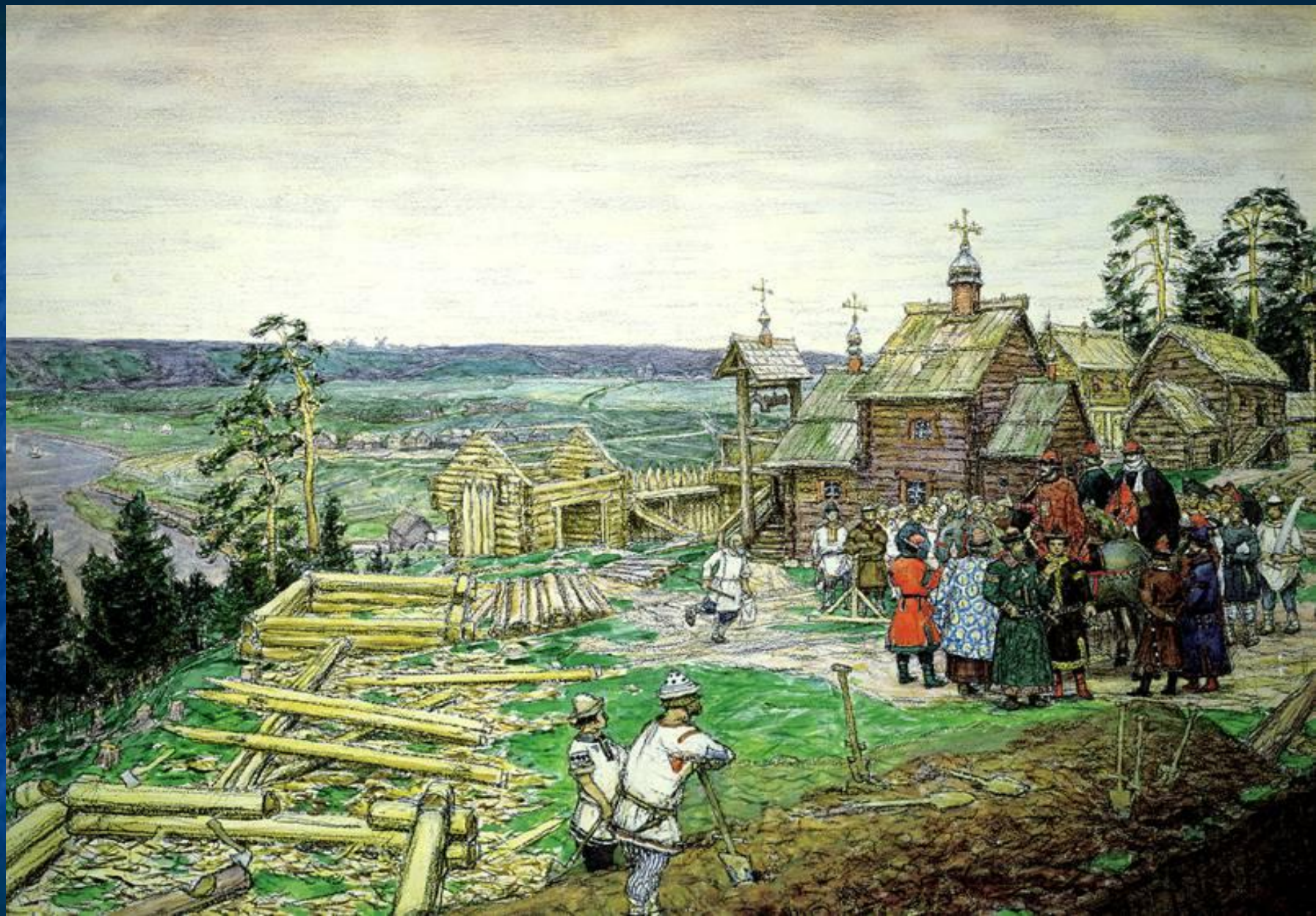
А.Васнецов «Основание Москвы»