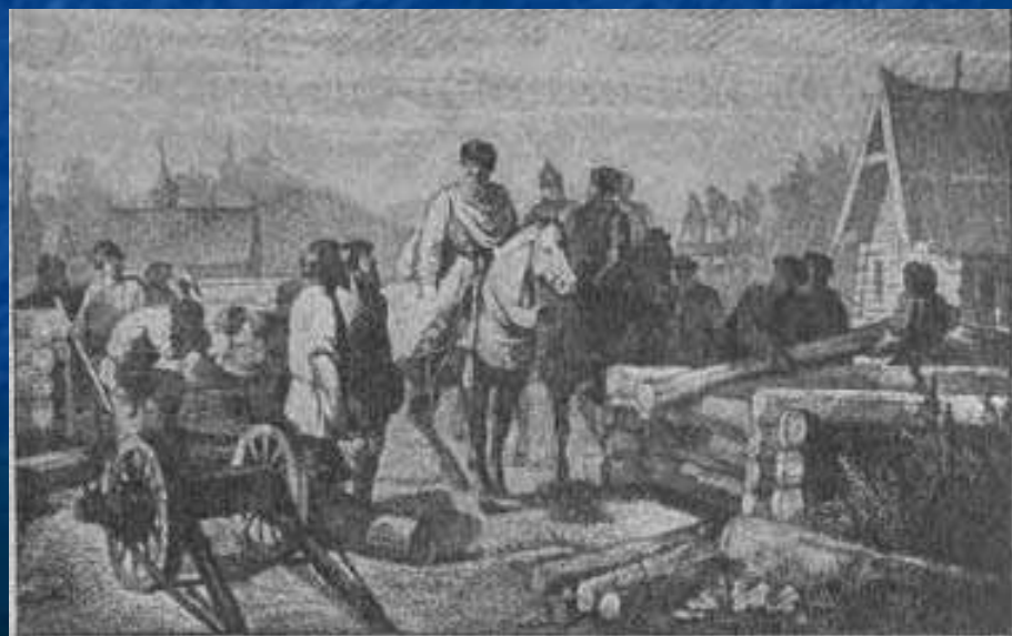
Юрий Долгорукий в Москве