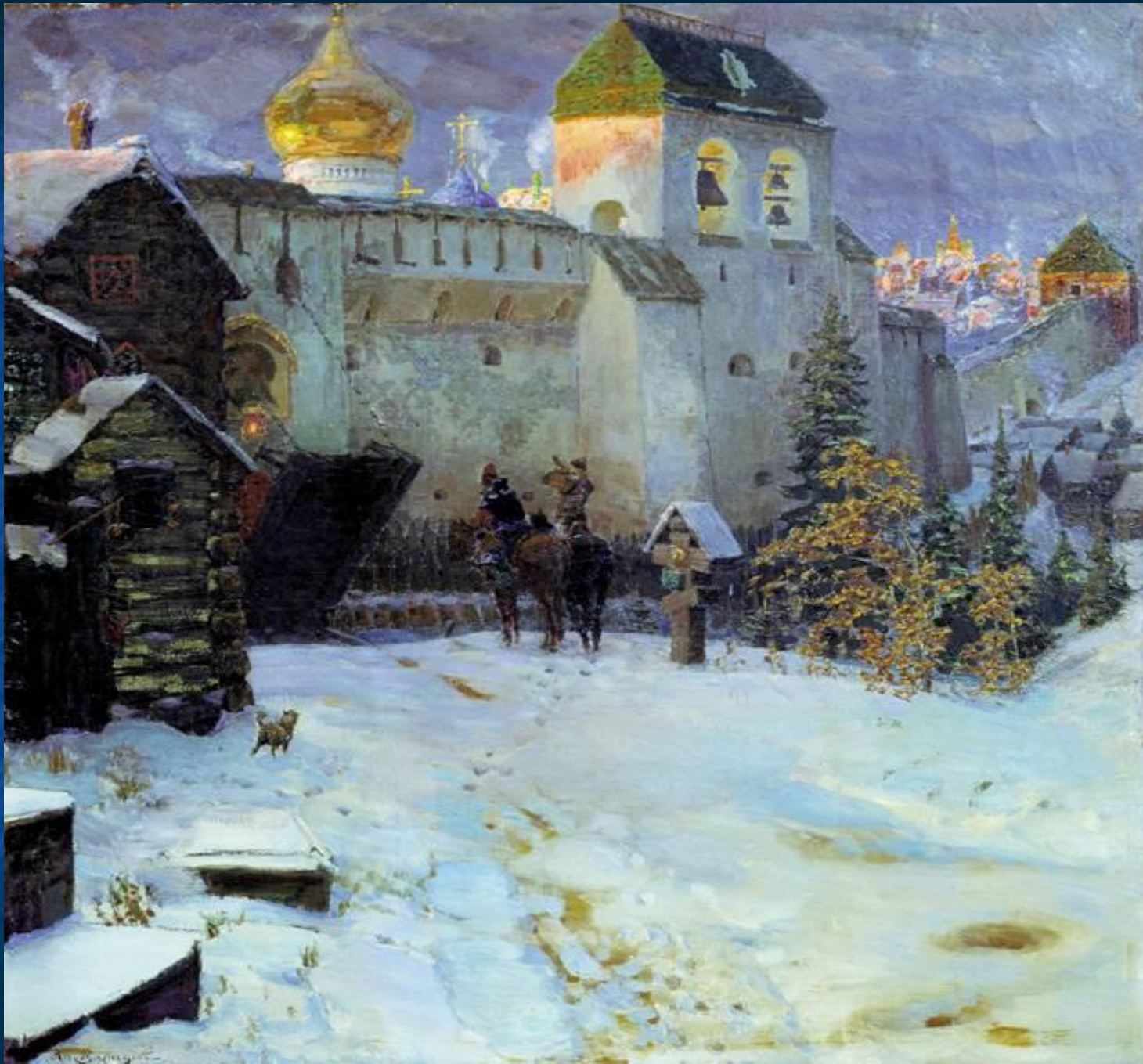
Древний город А. Васнецов