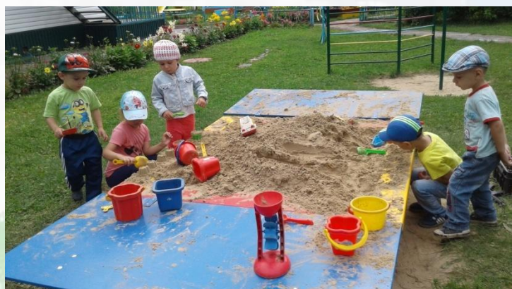
Игры с песком»