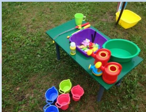
« Эксперименты с водой»