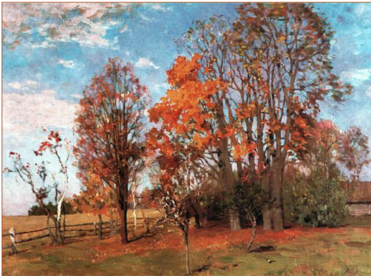
И. И. Левитан. Осень.