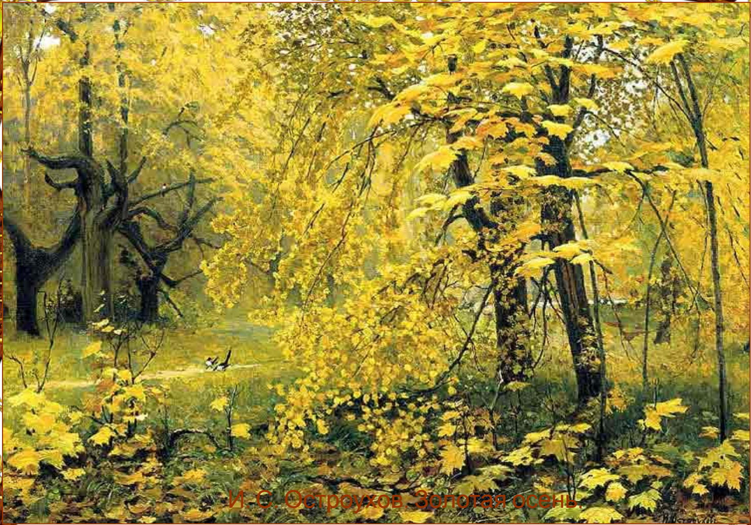
И. С. Остроухов. Золотая осень.