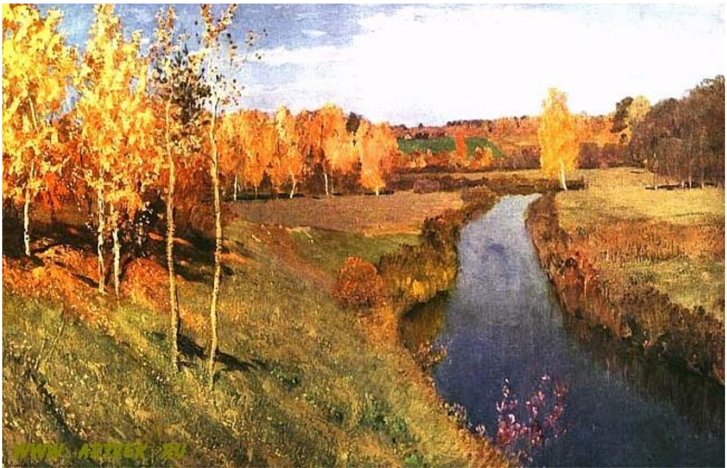
И. И. Левитан. Золотая осень.