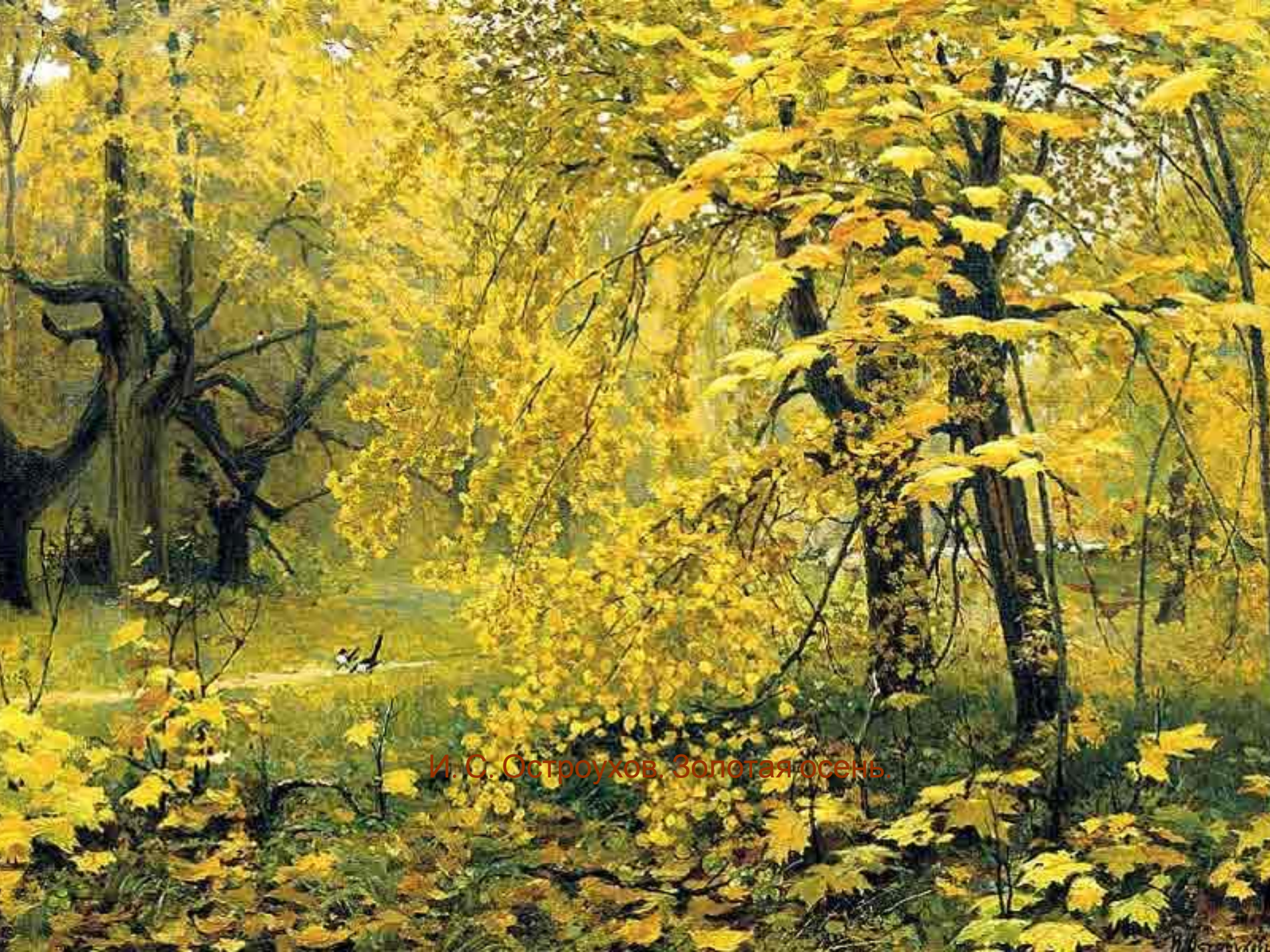
И. С. Остроухов. Золотая осень.