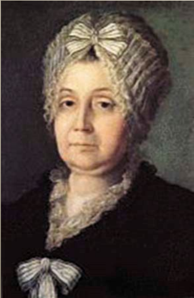
Мария Алексеевна Ганнибал