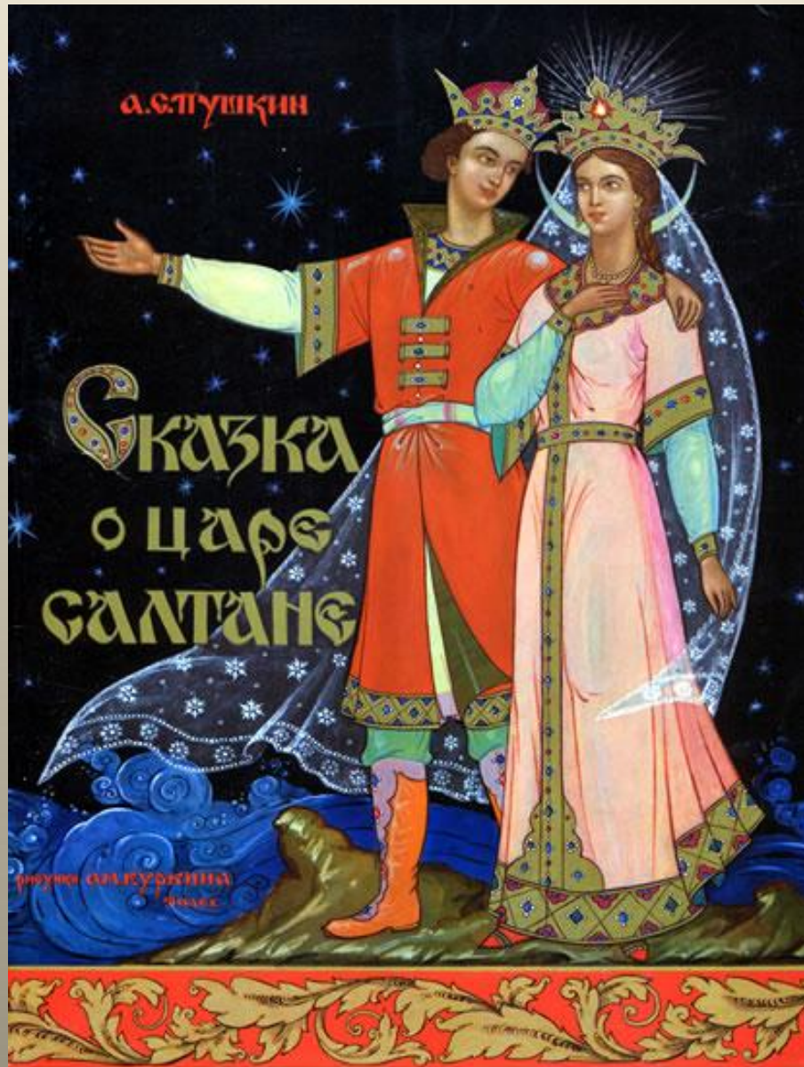
Иллюстрация М. В. ДОБРОУЛИНА