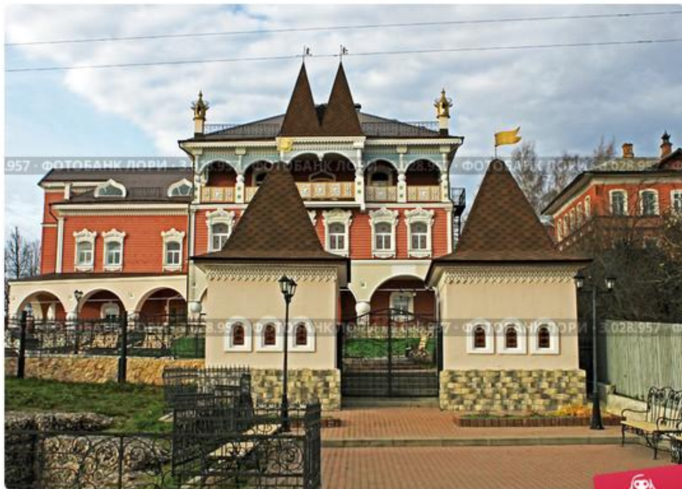
Музей "Мыши", г.Мышкин