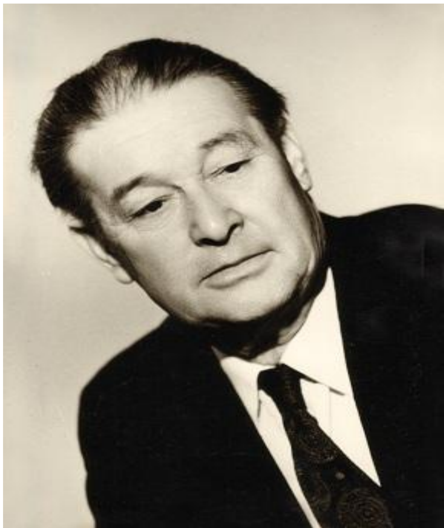
Файзи Гаскаров (1912 – 1984)