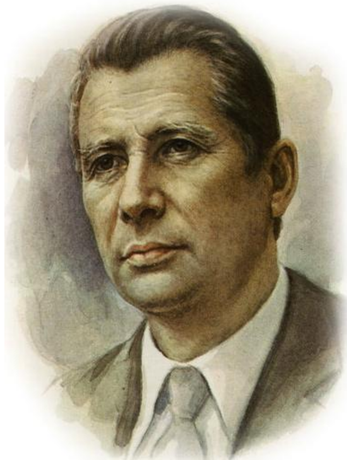
Андрей Яковлевич Эшпай (1925)