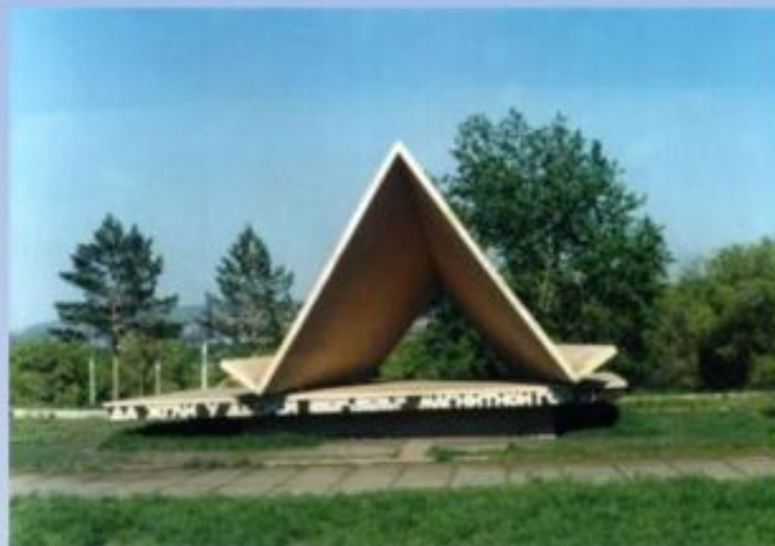
Памятник строителям Магнитки

На постаменте стихи магнитогорского поэта Бориса Ручьёва