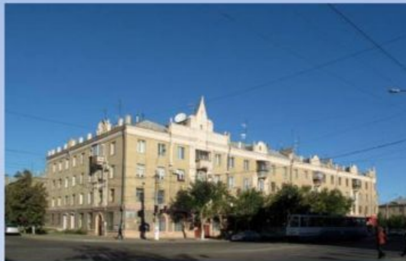
Проспект Карла Маркса