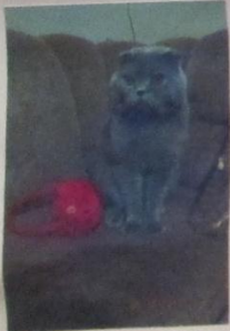
ПЛАЧЕТ КИСКА В КОРИДОРЕ

У МЕНЯ ЖИВЁТ КОТ. ЕГО ЗОВУТ «ТАЙСОН». ЕГО ПОРОДА ВИСЛУХИЙ ШОТЛАНДЕЦ. ОН МУРЛЫКАЕТ ТОГДА, КОГДА ЕГО ПОСРЯМАТ, ГЛАДЯТ. ТАКИМ ОБРАЗОМ ОН ВЫРАЖАЕТ СВОЮ БЛАГОДАРНОСТЬ ХОЗЯВВАМ. ОН ОЧЕНЬ ЛЮБИТ ИГРАТЬ С НАМИ.