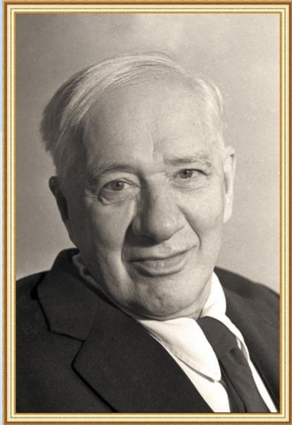
Корней Иванович Чуковский