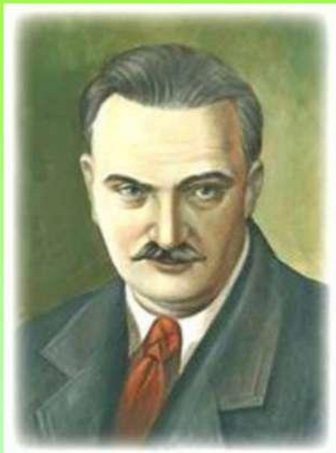
Виталий Валентинович Бианки