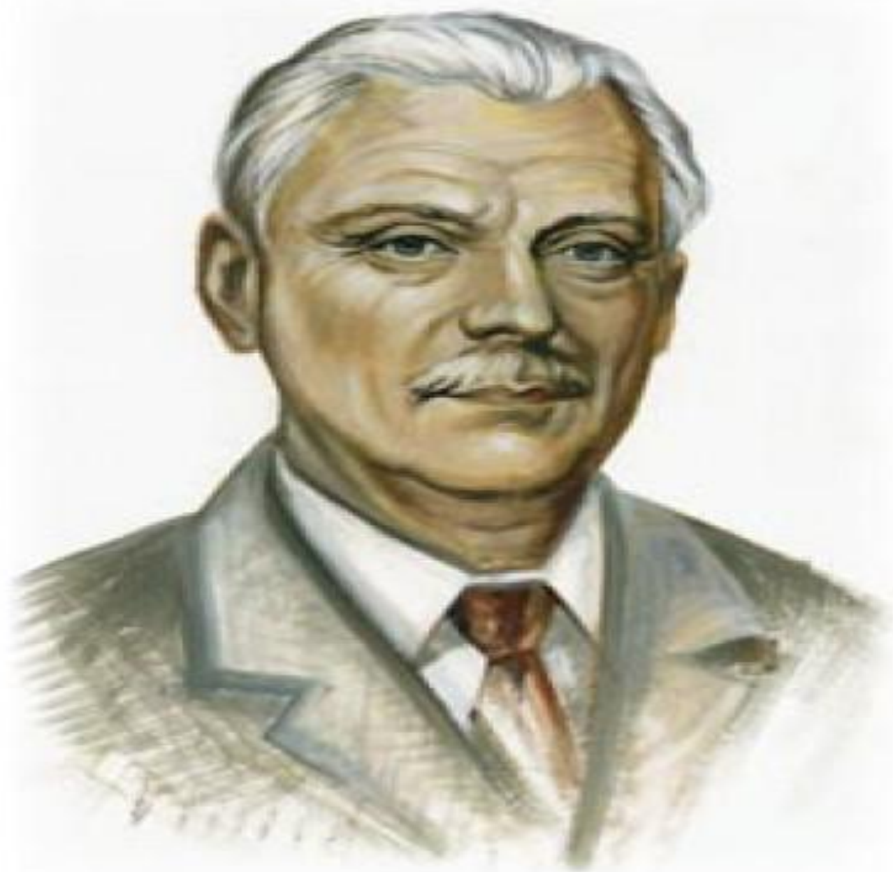
Михалков Сергей Владимирович (13.03.1913)