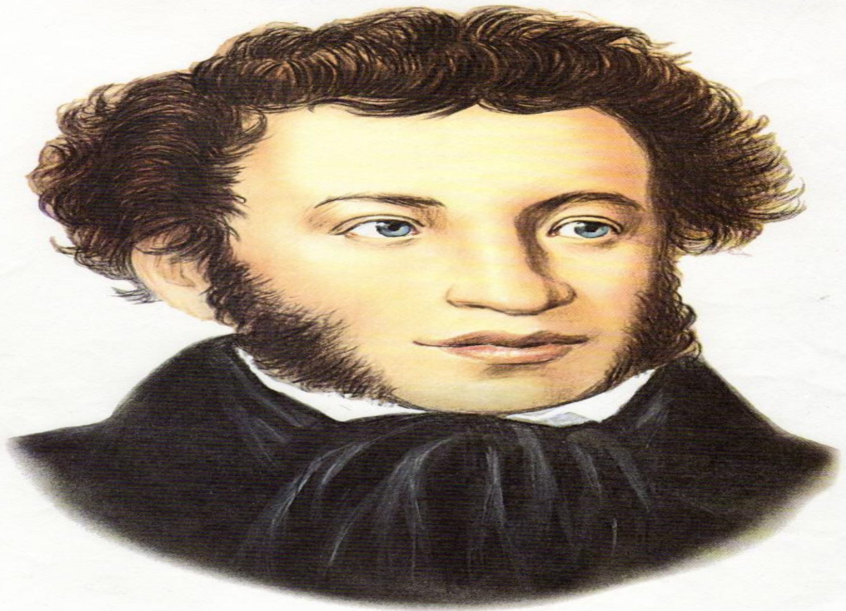
Пушкин Александр Сергеевич (1799-1837)