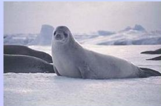
тюлень - крабояд