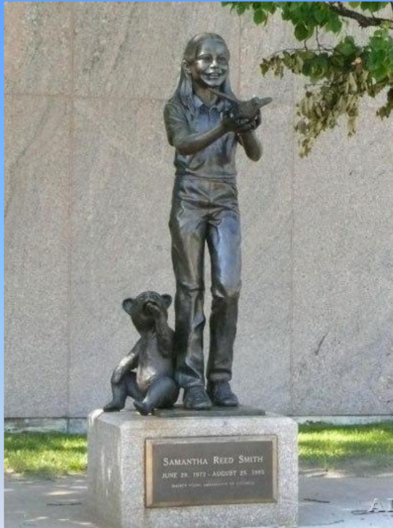
Памятник Саманте Смит в городе Огасте (штат Мэн, США)