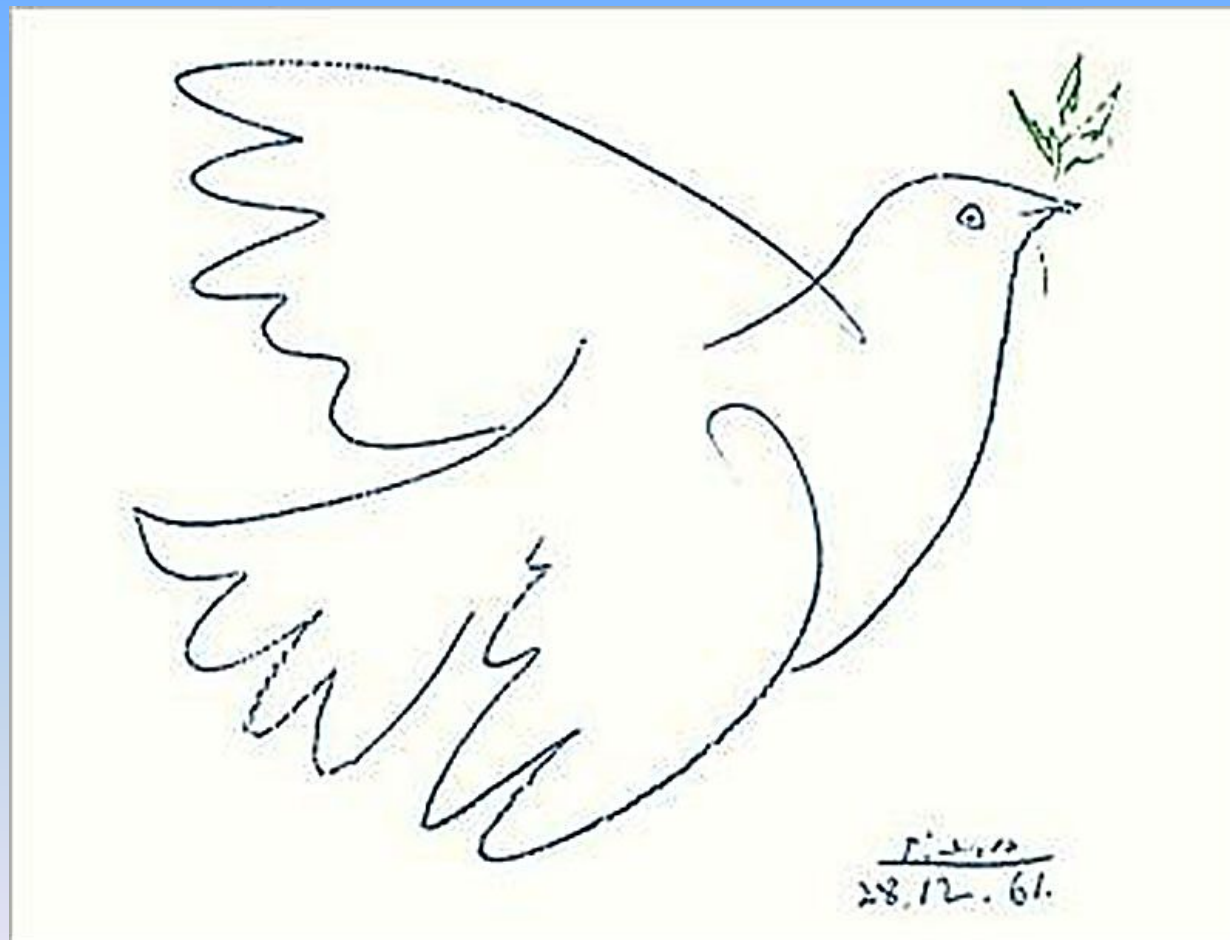
Рисунок 1961 года