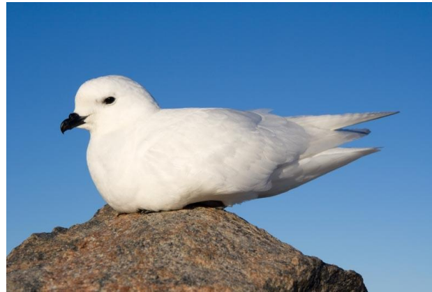
буревестники: гигантский и снежный