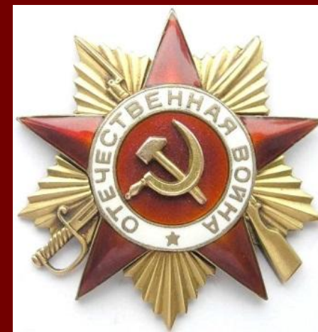
Орденом Отечественной войны II степени