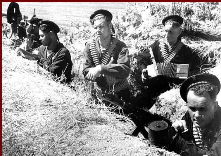
Морские пехотинцы. Август 1941-го

Родился в 1923 году в деревне Нюхча Архангельской области Пинежского района. Призван, на службу 04 апреля 1942 году, служил в морской пехоте, стрелком ... Осенью в октябре 1942 года от него было последнее письмо. А в январе 1943 года пропал без вести под Ленинградом (в это время, была военная блокада города Ленинграда немецкими, финскими, испанскими войсками с участием добровольцев из Северной Африки, Европы и военно-морских сил Италии во время Великой Отечественной войны. Длилась с 8 сентября 1941 года по 27 января 1944 года (блокадное кольцо было прорвано нашими войсками 18 января 1943 года) — 872 дня.)