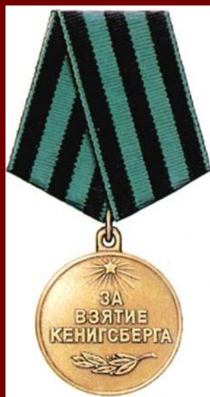
Медаль «За взятие Кенигсберга»