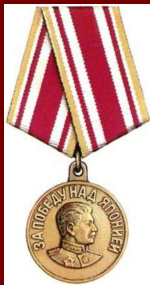
Медаль « За победу над Японией »