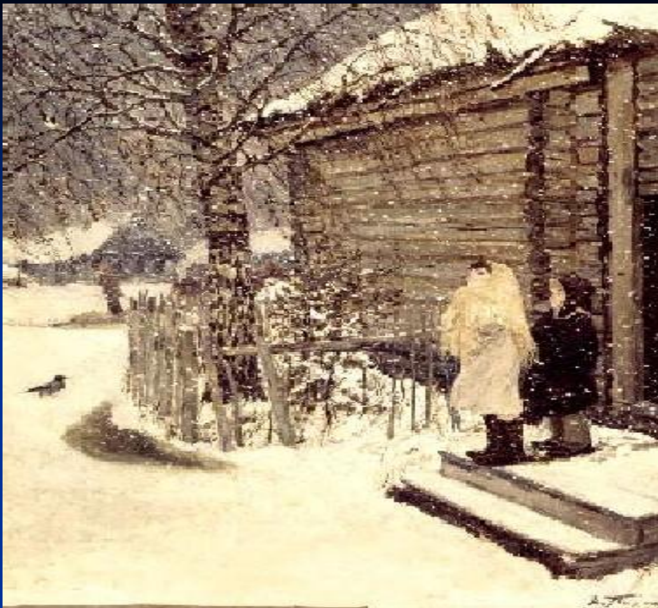
А.Пластов «Первый снег»