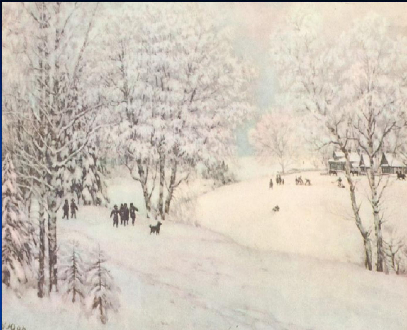
К.Юон «Русская зима»