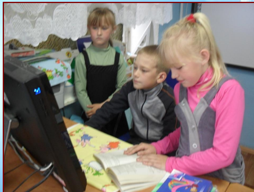
Работа над презентацией проекта