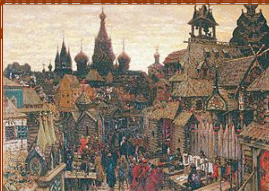
Аполлинарий Васнецов. "Старая Москва. Улица в Китай-городе начала XVII века"

3. Какое историческое событие произошло 4 ноября (22 октября) по старому стилю?