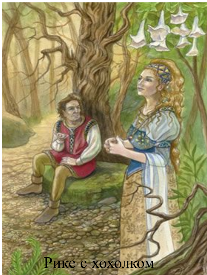
Рике с хохолком

Жизнь красотой его не наделила, Зато умом сверх меры наградила. Ум и помог ему счастливым стать. Кто может его имя отгадать?