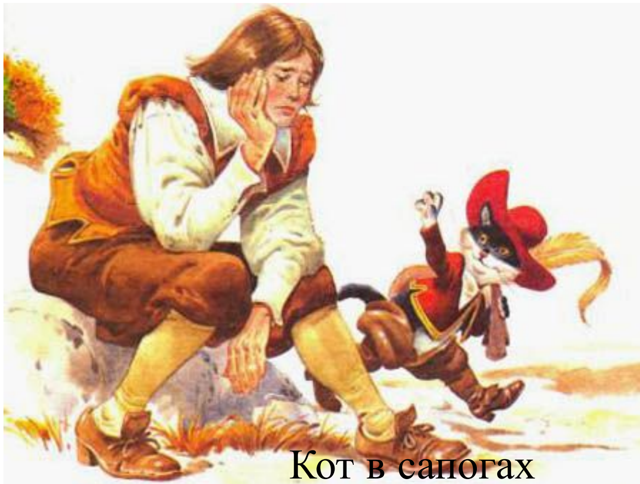
Кот в сапогах