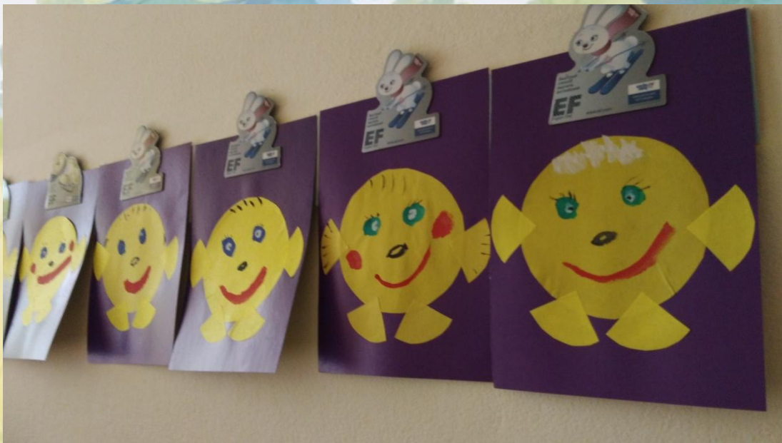
Аппликация «Колобок-румяный бок»