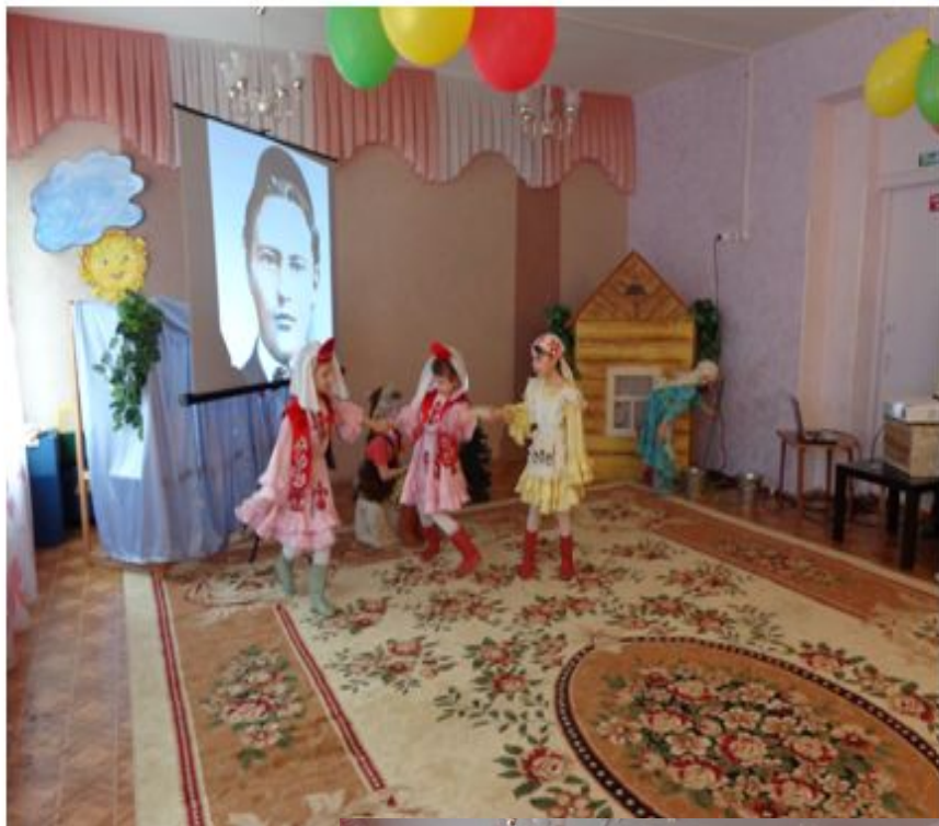
Татарская сказка «Өч кыз» в детсокм саду