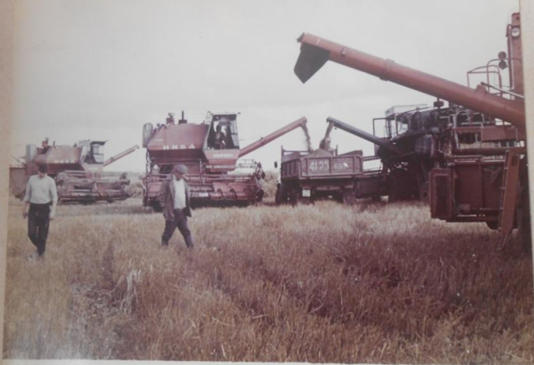
Уборка урожая в колхозе. 1994 г.