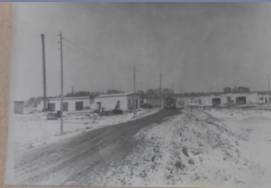
Тумшинский животноводческий комплекс, построен в начале 80-х годов