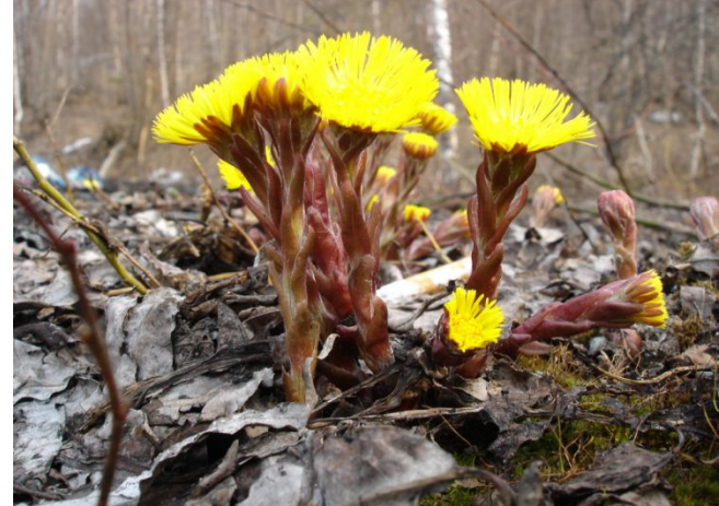
МАТЬ - И - МАЧЕХА