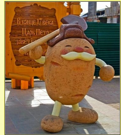
Памятник картошке в г. Мариинске