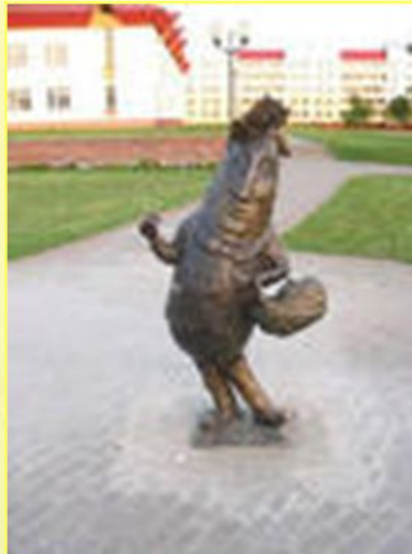
Памятник картошке в Белоруссии