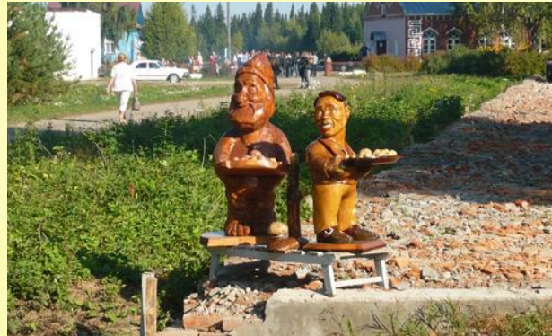
Памятник Вятской картошке