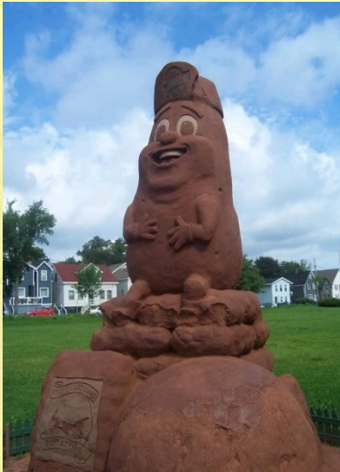
Скульптура из песка «Мистер картошка» на острове принца Эдварда

2 3 июля в России – День молодой картошки.