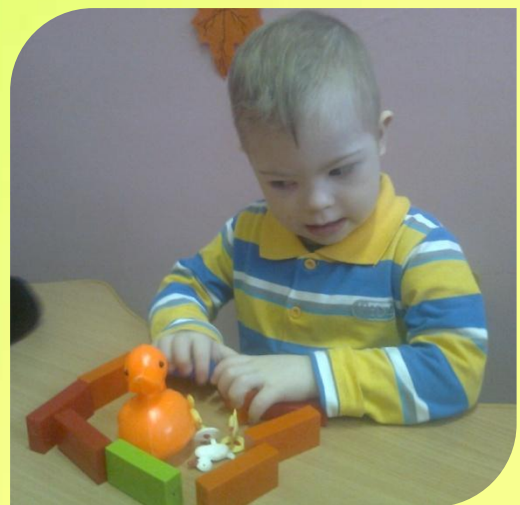
Ознакомление с окружающим