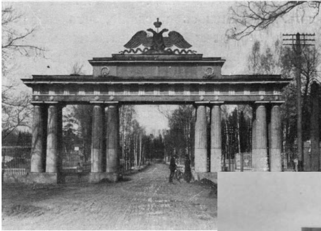
Ворота в Павловске