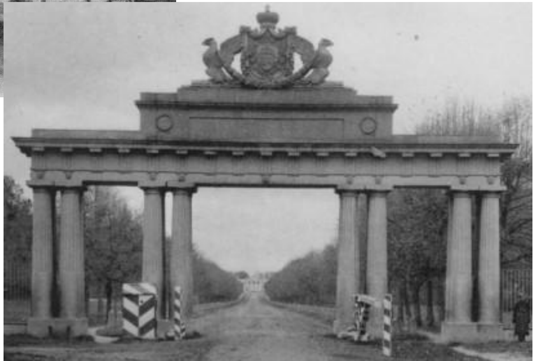
Ворота в Кузьминках