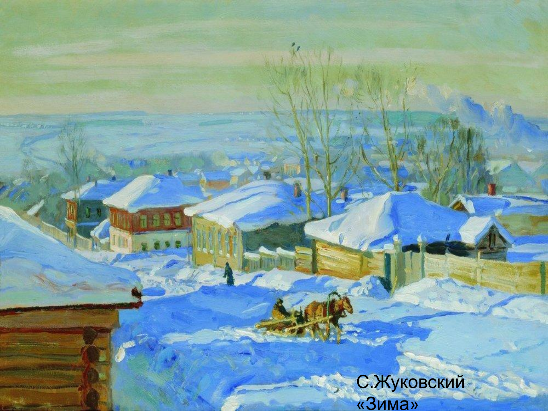
С. Жуковский «Зима»