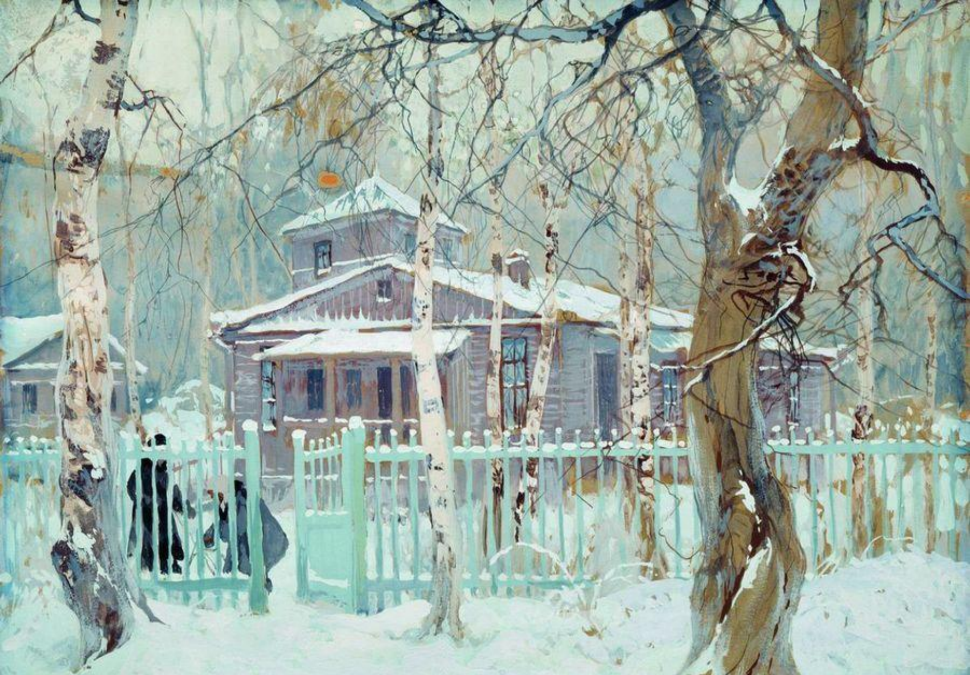
С.Ф. Колесников «Зимний пейзаж» 1917.