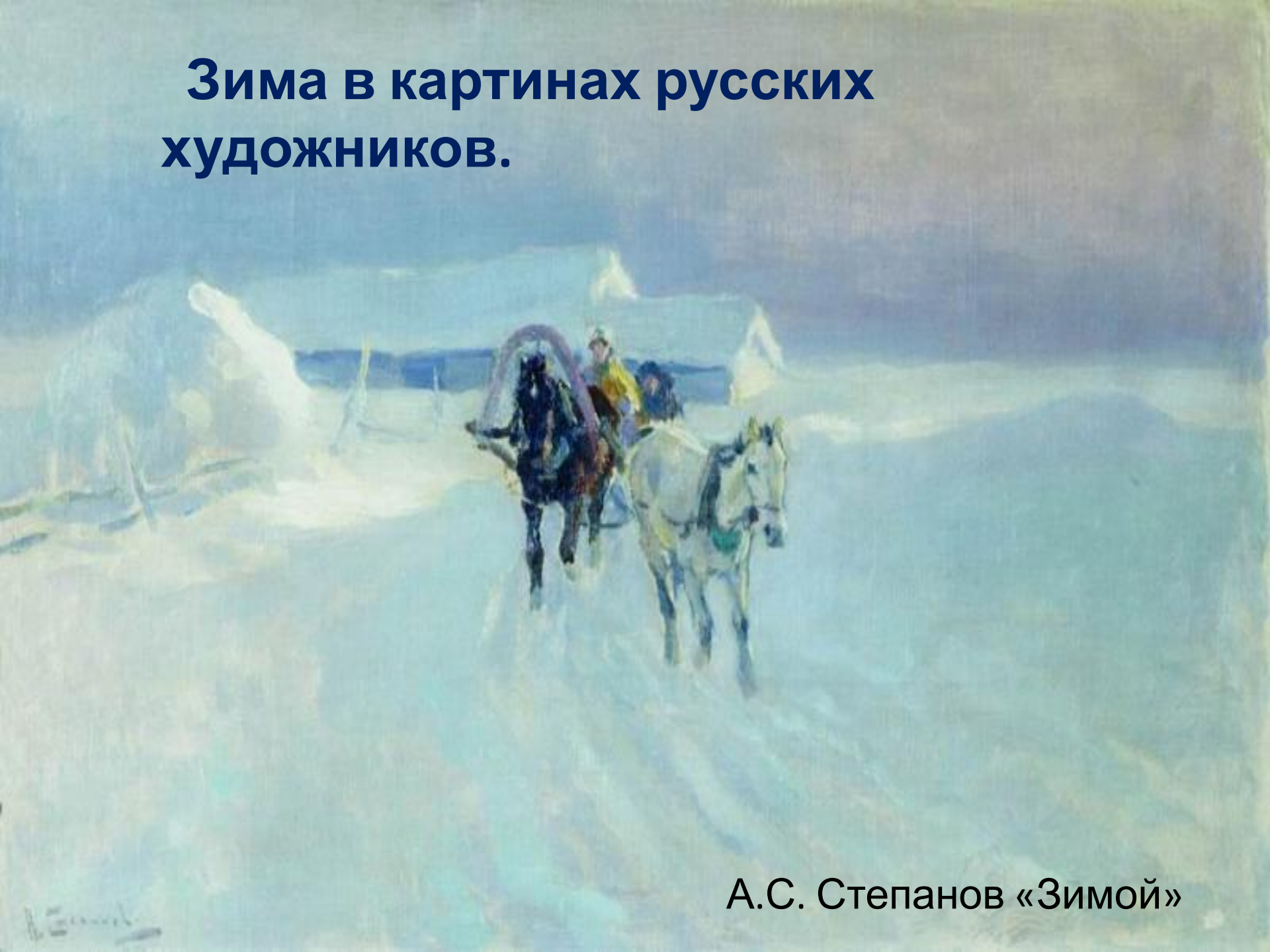
А.С. Степанов «Зимой»