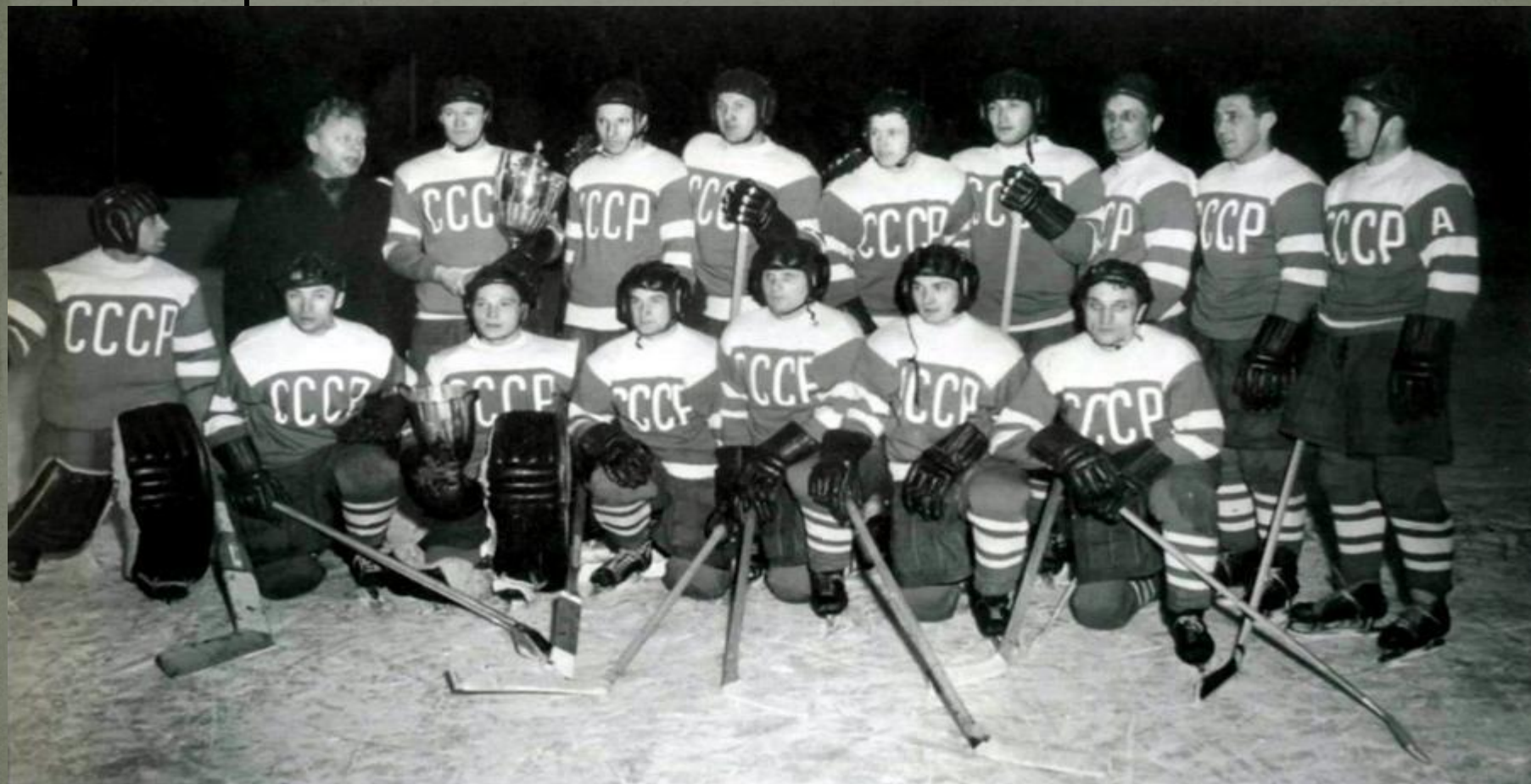
1954.03.07 Стокгольм ЧМ СССР 7 - 2 Канада Сборная СССР - чемпион мира и Европы