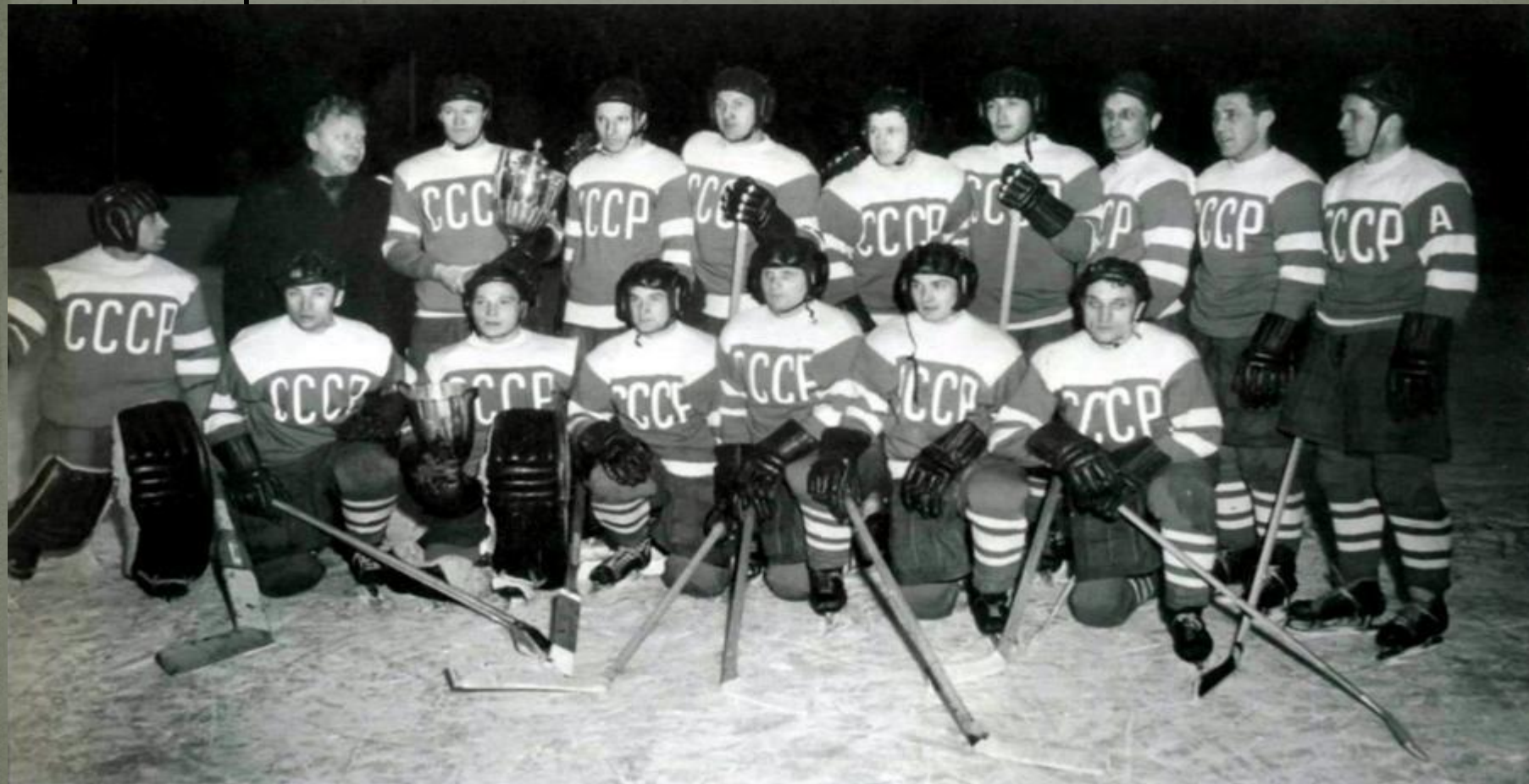
1954.03.07 Стокгольм ЧМ СССР 7 - 2 Канада Сборная СССР - чемпион мира и Европы

По окончании тренерской карьеры работал директором Динамовской школы. Не один десяток хоккеистов учеников Чернышёва стали заслуженными мастерами спорта, чемпионами Олимпийских игр, победителями чемпионатов мира и Европы.