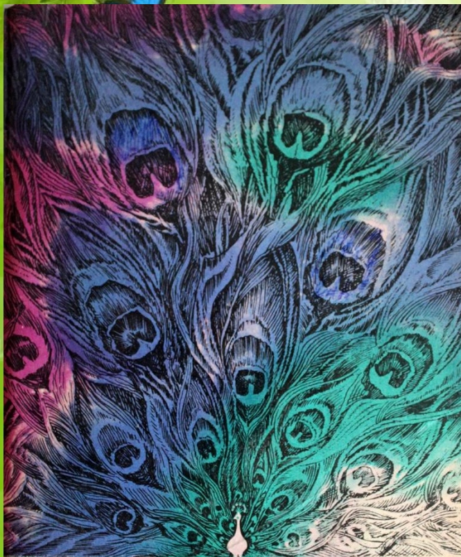
Николай Леденцов ЧУДЕСИЯ

Эта книга - о птицах. Прочитав ее мы узнаем, что бекас (научное название) "поет" хвостом и эти звуки похожи на бляение барашка; еще, чем отличается змеешейка от вертишейки. Часто в книге указаны и научные и просторечные названия птиц. В этой книге больше текста, чем картинок. В углу практически каждой страницы - черно-белое изображение птицы, а ниже - замечательный рассказ о ней. Читая описания, легко представить себе каждую птицу. Рассказы о птицах интересно читать вслух. Когда пытаешься подражать птичьему чириканью, вызываешь у близких людей улыбку. Рассказы о птицах идут по алфавиту, а в конце книги - тексты о самых удивительных птицах: самых изобретательных, самых крупных, самых говорливых и прочих самых-самых.