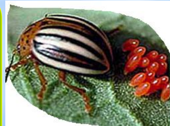
Яйца колорадского жука

У божьей коровки очень хороший аппетит, она находится в постоянном поиске пищи – тлей, клещей, яиц и личинок жуков. А плесень и пыльца служат полезной добавкой к ежедневному рациону.