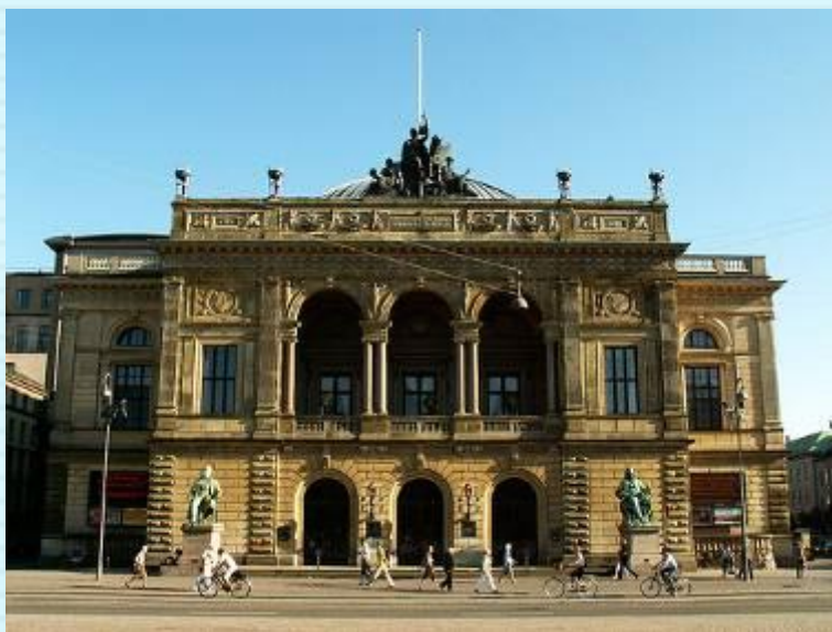
Театр в г.Копенгагене

Когда она выросла, почему он решил покинуть её и дом, юный Андерсен тотчас ответил: «Чтобы стать знаменитым!»