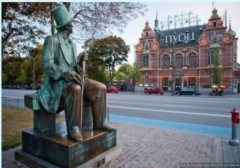
Памятник Г.Х. Андерсену в г.Копенгагене