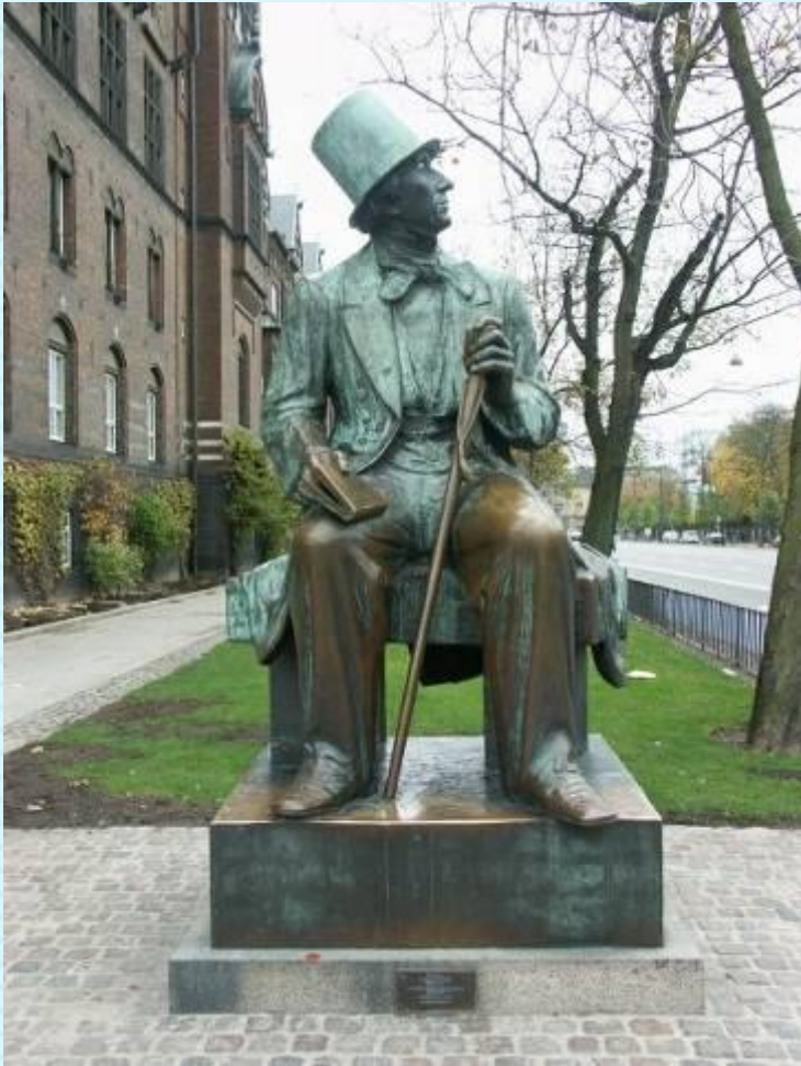
Памятник Г.Х.Андерсену в Копенгагене

Давным-давно цыганка нагадала матери Ганса Христиана, что ее «сын станет великим человеком, и город зажжет иллюминацию в его честь».