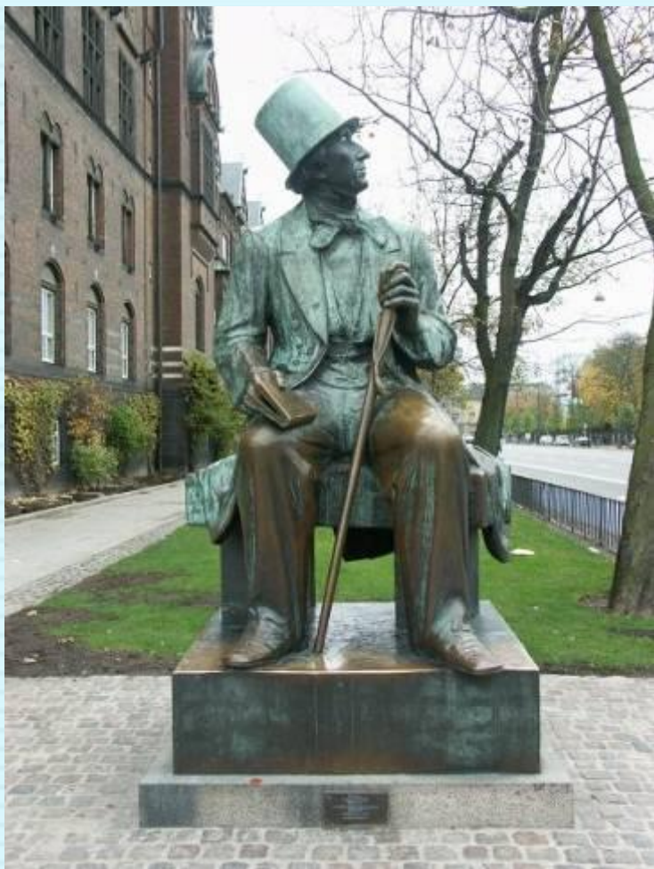
Памятник Г.Х.Андерсену в Копенгагене

Давным-давно цыганка нагадала матери Ганса Христиана, что ее «сын станет великим человеком, и город зажжет иллюминацию в его честь».