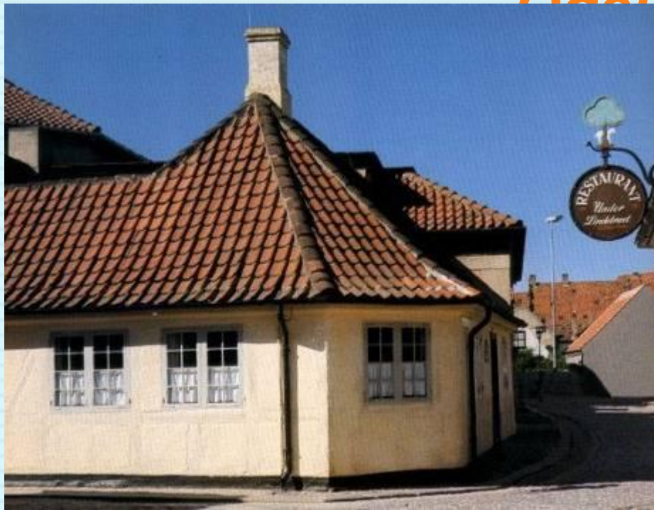
Город Оденсе. Дом, в котором родился писатель.

Отец его был бедным башмачником, а мама – прачкой. Семья жила очень бедно. В доме не было ни богатой