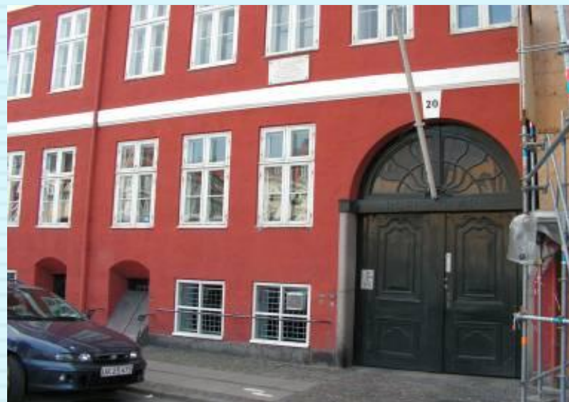
Дом Г.Х. Андерсена в г.Копенгагене