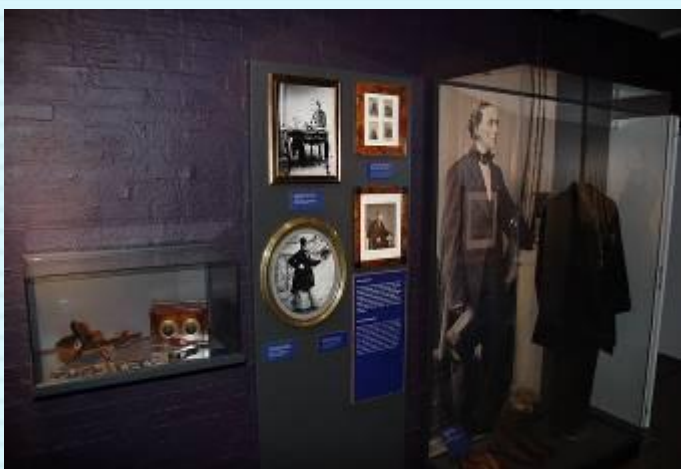
В музее Г.Х. Андерсена