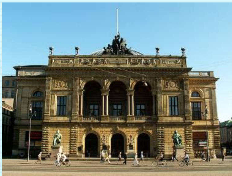
Театр в г.Копенгагене

Когда она выросла, почему он решил покинуть её и дом, юный Андерсен тотчас ответил: «Чтобы стать знаменитым!»