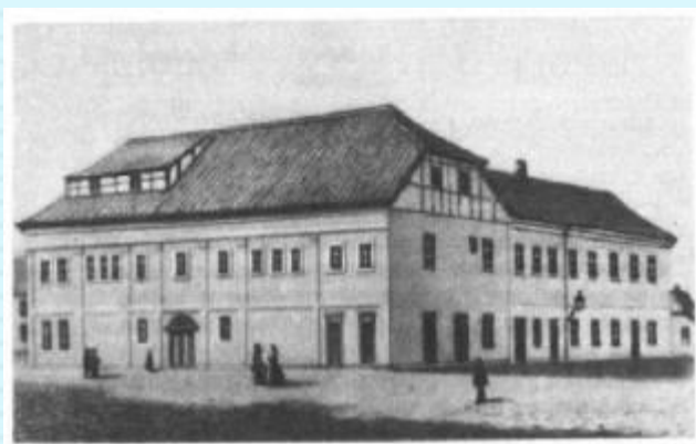
Театр в г.Оденсе

Королевского театра Копенгагена сыграли, решающую роль в выборе