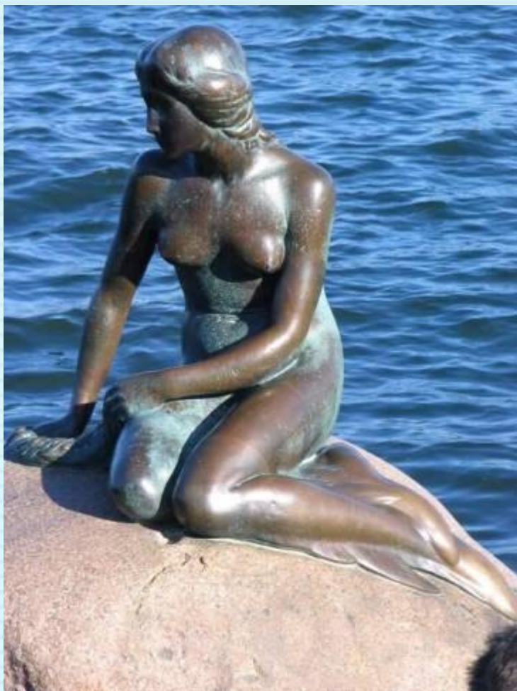
Памятник Русалочке в Копенгагене

Великому сказочнику и его героям поставлены памятники. А героиня сказки Г.Х.Андерсена «Русалочка» стала символом столицы Дании – Копенгагена. Начиная с 1967 года по решению Международного совета по детской книге 2 апреля